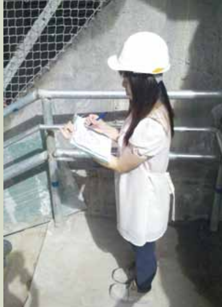
工作期間有需要到工地視察實際情況

「辦法總比困難多」，人生路上經歷了一次又一次的挫折，便學懂了遇上不順意的事時不要灰心，要冷靜地想辦法，主動地尋求協助。印象最深的一次是人工耳蝸手術後，因左面癱瘓而需花時間進行物理治療，但我並沒有因這件事而氣