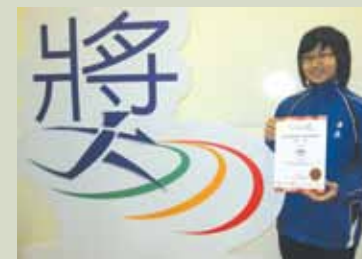
2010年在眾多健兒中脫穎而出，獲得「屈臣氏集團香港學生運動員獎」