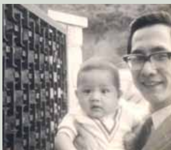
一歲時與父親攝於藹寧園