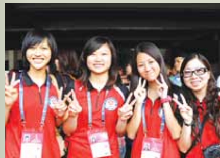
入選香港羽毛球隊後，曉晴到過不少國家作賽，也結識了許多好朋友