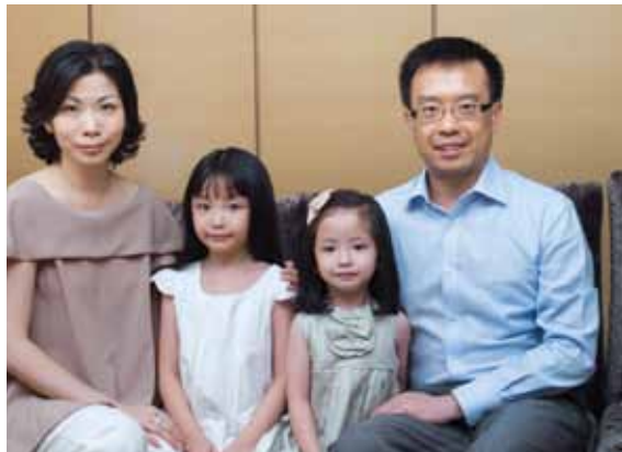
與太太及兩千金的家庭照

容涉及我們的專業，我們便會自動調好頻道，對答如流。這是因為我們對自己專業的知識有充分理解，對別人的提問和意見較容易舉一反三，大腦也會自然篩選和過濾談話內容，這種情況在那一個行業都如此。