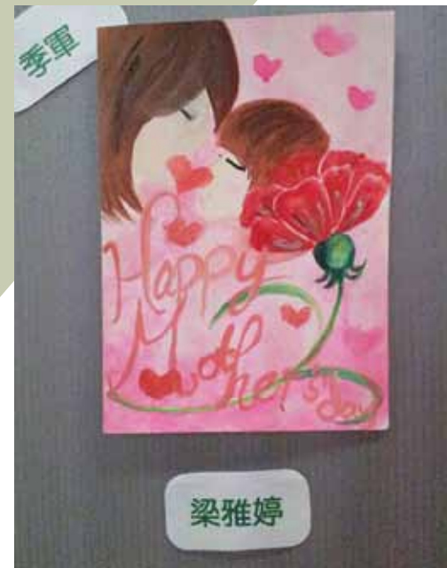
2012年母親節卡設計比賽季軍作品

一片溫暖的粉紅色，一支燦爛綻放的康乃馨，一對母女閉上雙眼相對著，她倆面帶微笑的神情，洋溢出無比的幸福，令旁觀者都能感受到她們的溫馨愛意。