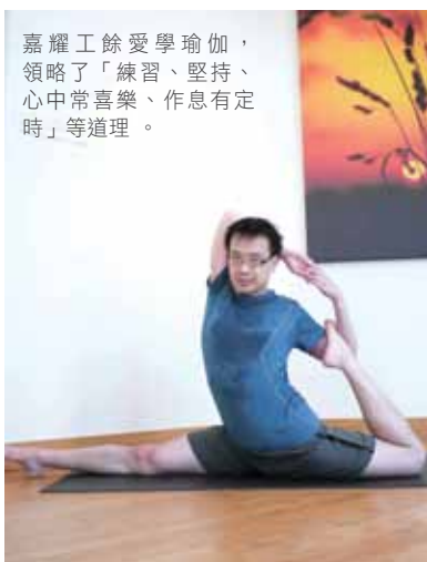
嘉耀工餘愛學瑜伽，領略了「練習、堅持、心中常喜樂、作息有定時」等道理。

求學最大的困難是如何跟上進度，成績一旦落伍便有退回特殊學校學習之虞。因此每天放學後都得花上比同學多三、四倍的努力去複習及預習課業，星期六、日也要繼續補習，周而復始。當時年紀小，以眼代耳，用眼費神，每天固定有二小時午睡，以致社交活動也比同學少。中學階段我轉往英國讀書。異鄉的學習環境，教會了我要刻苦自律外，足夠休息及社交娛樂也十分重要。我也學會了給自己定下高中低優先次序：學業上，基礎知識要打好；生活上，要睡好、不要過慮、多抽時間與家人相處、常與益友良師為伴，處事