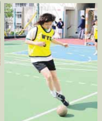
曉晴熱愛田徑，也喜歡球類活動，是校際比賽的常勝將軍，在學以來獲獎無數