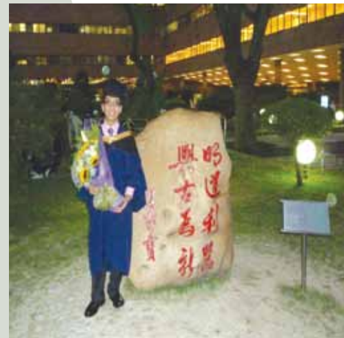
志剛一直有志於醫療服務工作，入讀理工大學康復治療科學系並順利畢業