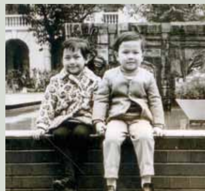
與姊姊攝於中環皇后像廣場