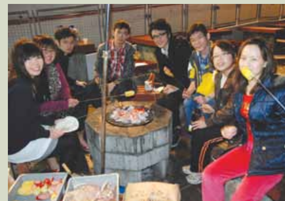
與HISN朋友開開心心燒烤

餒，手術後更一邊做言語治療一邊繼續預備會考。加上老師及同學在我復課後都義不容辭地幫忙，照顧我的需要及提供協助，使我在那次會考獲得不錯的成績。