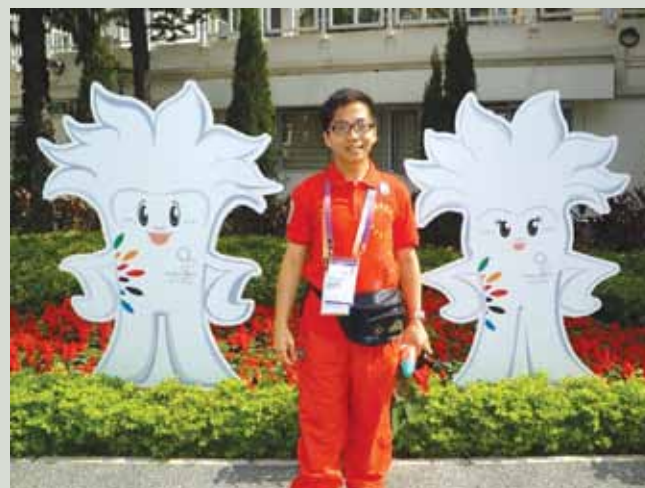
有幸參與2009年東亞運動會義工

我自小便患有輕度聽障，一直都在主流學校讀書，和聽力正常的同學們一同學習。從外表看來我與常人無異，故此，有時候會被人忽略了自己的困難，與人相處也引起許多誤會。小時候我並不懂向老師表達自己的需要，有時被編於較後的座位，使我不能完全清楚老師的說話。到我懂得向老師反映並獲安排坐最前排的位置時，又惹來同學誤會我扮專心、離群和爭取表現。高中時有些課堂可讓同學自由選擇座位，而年青人多愛坐在較後的位置，這使唯一坐於最前面的我有種被孤立的感覺。我也試過因聽得不清楚，對同學的說話沒有反應，讓他們誤會我性格高傲而疏遠我，或因我發音不正而遭取笑，這些種種，都使年輕的我倍感難受。但隨著年紀漸長，我學懂了有需要向同學解釋我的情況，這一方面可以打開自己的心扉，不至耿耿於懷，另一方面多溝通也使他們明白我的處境，加以體諒，減少誤會。