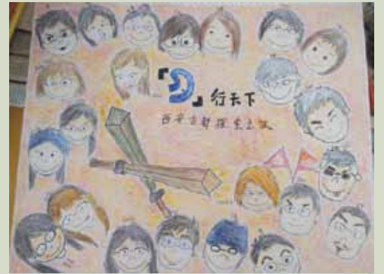
2009年萃欣參與香港聾人福利促進會主辦的「聾」行天下—西安古都探索之旅時攝