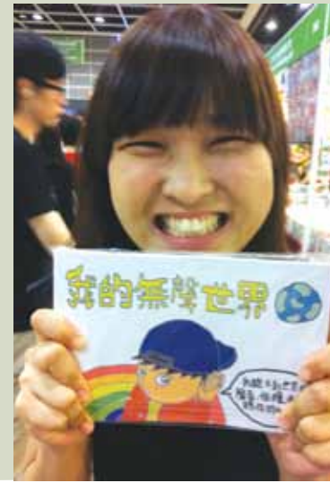
先天雙耳嚴重失聰，無改其開朗愛笑的性格，是大家的開心果