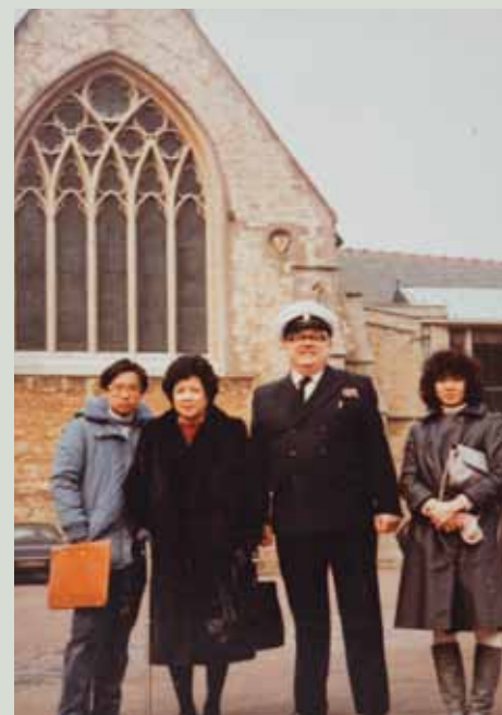
負笈英倫成了嘉耀人生的轉捩點，從此改變了他的人生及世界觀