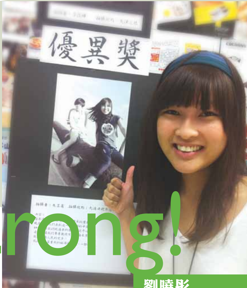
2011年參加香港聾人福利促進會主辦的「聾」行天下-天津之旅，滿載了快樂的回憶