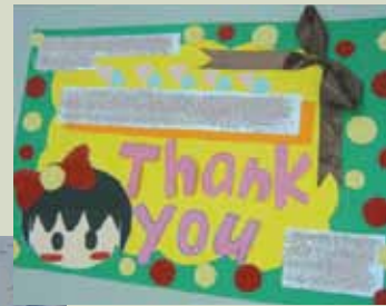
到幼稚園交流學習時，和同學一起手製的感謝卡