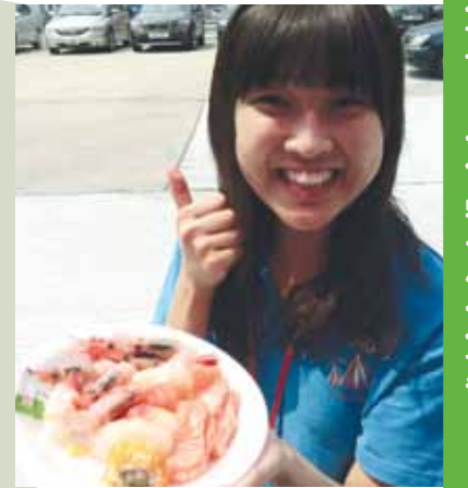
誰能按捺得住美食的誘惑呢？

上學的日子，曾經自卑得經常裝不舒服來逃避上學，最後還是被家人發現了。媽鼓勵我不要放棄，她說：「他們是不明白啊！所以才會好奇地看著你。你應該大方告訴他們，你是因為聽覺比較差，所以要帶助聽器，就像一些人有近視，所以要帶眼鏡，都只是很普通的一回事。」「你沒有不同，他們做到的事你一樣做得到，只是你要花比較多的時間和努力，懂嗎？」我含淚問：「是嗎？我真的可以？」在她的懷抱裡，我忍不住放聲大哭，想把心裡所有鬱悶都隨著眼淚流走。她溫柔地在我耳邊說：「不要哭了，我相信你一定可以很勇敢的」嗯，只要有母親在，我什麼都不怕了。