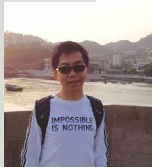
閒時愛旅遊豐富自己見聞

我想鼓勵在學的聽障朋友，你們一定要有不要放棄的心，要接受自己的聽障，只要你肯努力，任何困難都可以解決。你們也要打開自己的心扉，真誠結交健聽的同學，這會使你的求學路上多了同行者，多一點色彩。另外，我也想強調家庭的支持對聽障人士的求學路是很重要的，因家庭是聽障者最大的動力和後盾。當年我求學時，父母給予我無限的鼓勵，會不時糾正我的讀音，會與我一同溫習，也會聆聽我在學校時遇到的困難，使我很強大的動力並養成健康的心智，到現在我仍很感謝他們。故此，希望各位聽障孩子的家長們，給你們的孩子多一點愛心和耐心，你們是他們最好的後盾和成長的同行者。