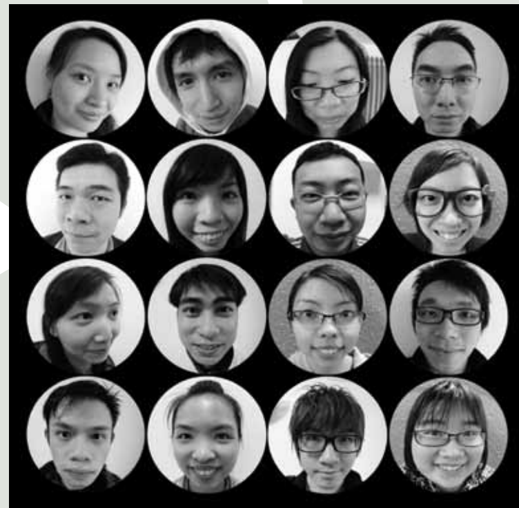
「藝無疆：新晉展能藝術家大匯展2012」入圍作品

我很高興能夠加入HISN這個大家庭，在這裡大家可以互相支持和鼓勵，給予我一種很溫暖的感覺。透過大家互相分享彼此的經驗，也使我從中得到一些啟發，獲益良多。這一次真的感謝HISN，讓我有機會和各位聽障朋友分享我的經歷，希望大家懷着信心，繼續努力，前路是一片光明的。