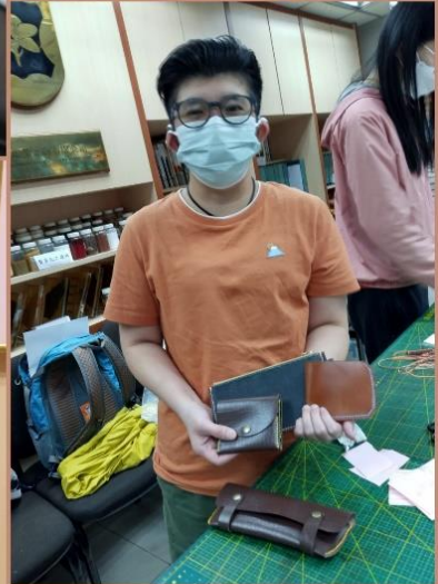
各同學的製成品都相當吸引，希望大家繼續練習，有興趣的還可製作自家產品到市集擺賣，展現手作品的威力！