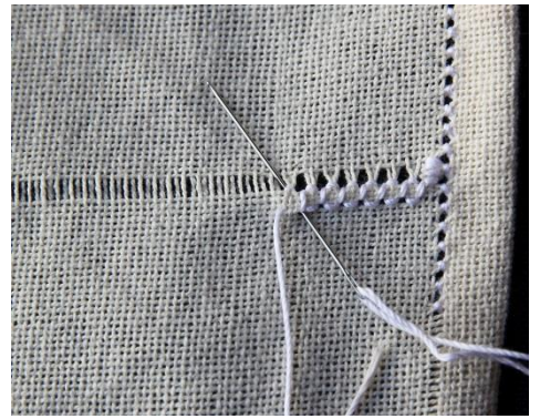
Négyes szászorító öltés 1-2-3.