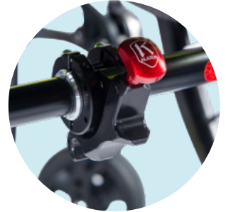
ZM02 Montage propulsion arrière