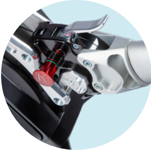
ZA52 Système de couplage central