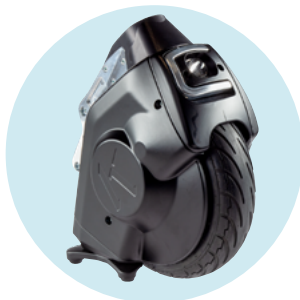
Vue frontal Phare LED intégrée