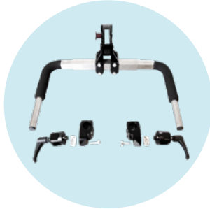
ZA58 Système de couplage latéral