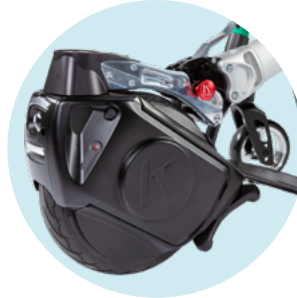
ZM01 Montage à l'avant SANS guidon