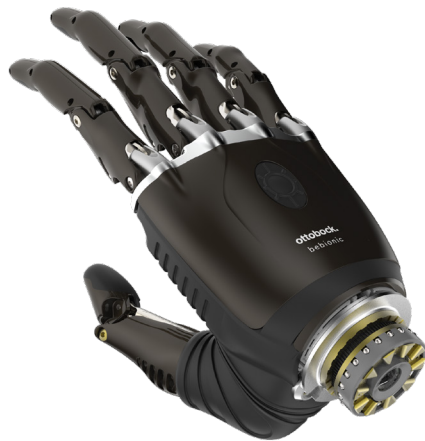
Mano bebionic EQD