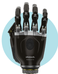
negro mate metalizado