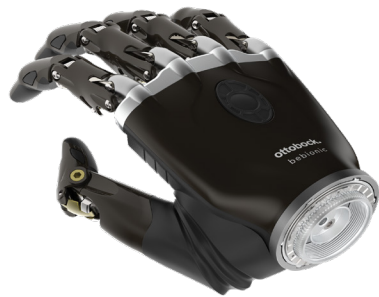
Mano bebionic desarticulación muñeca