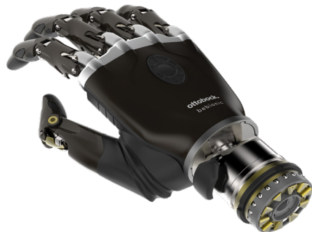
Mano bebionic Flex