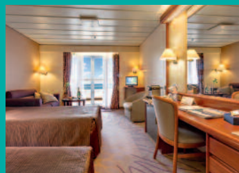
2-Bett-Junior-Suite, Balkon, Jupiter-/Lido-Deck (Kat. S, T)