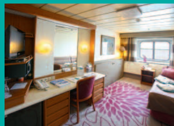
2-Bett, Neptun-/Saturn-/Orion-/Apollo-Deck (Kat. I, J, J1, K, L, M, O)