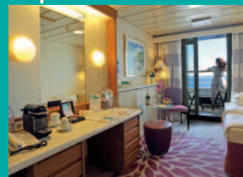
2-Bett-Superior, Balkon, Orion-Deck (Kat. P)