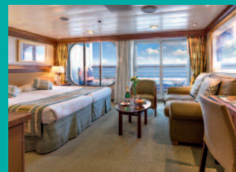
2-Bett-Junior-Suite, Balkon, Jupiter-Deck (Kat. S+)