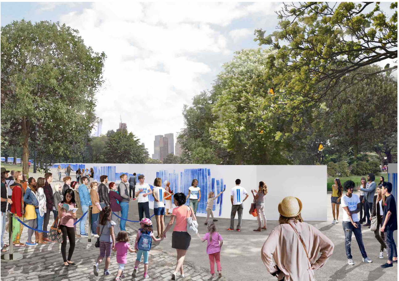
Visualisering af Breathe with Me i Central Park, New York City.