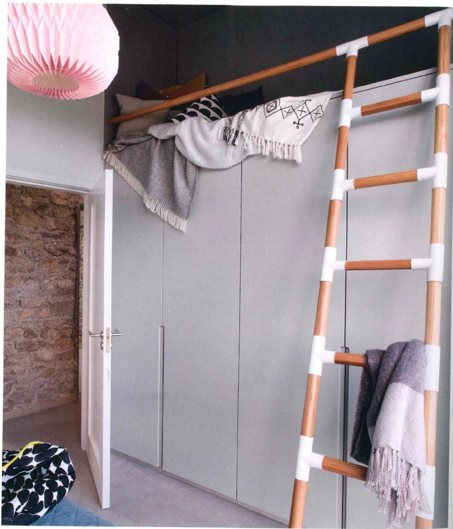
Dimensione privata. SOPRA: arredi su disegno per la camera della figlia. Il letto con scala, posto sopra l'armadio, è realizzato da Moore & O'Gorman. Lampada di Habitat, biancheria di Ferm Living e House of Fraser. PAGINA SEGUENTE: una camera degli ospiti. Il lampadario a grandi perle in legno proviene da Out There Interiors, come i comodini rivestiti in pelle. Sopra il letto, due lampade a parete acquistate su Made.com.