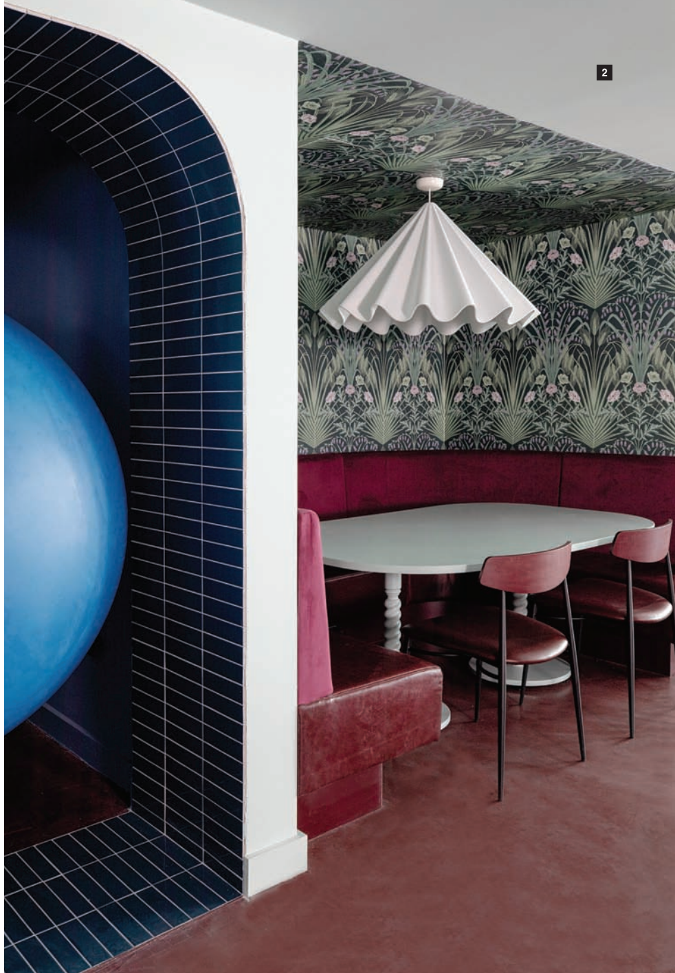
2_ 오브제에서 차용한 아치와 곡선은 품격 있는 분위기를 연출한다. 롤리팝을 닮은 조명과 형형색색의 테이블 등 모든 요소가 모여 이곳만의 차별성을 부여한다.