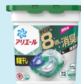
アリエールジェルボール4D

変わりゆく洗濯環境に対応し、除菌や漂白機能の付加、ジェルタイプの導入とラインナップを広げ、多様化する消費者ニーズに答えている。