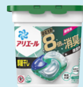
アリエールジェルボール4D

変わりゆく洗濯環境に対応し、除菌や漂白機能の付加、ジェルタイプの導入とラインナップを広げ、多様化する消費者ニーズに答えている。