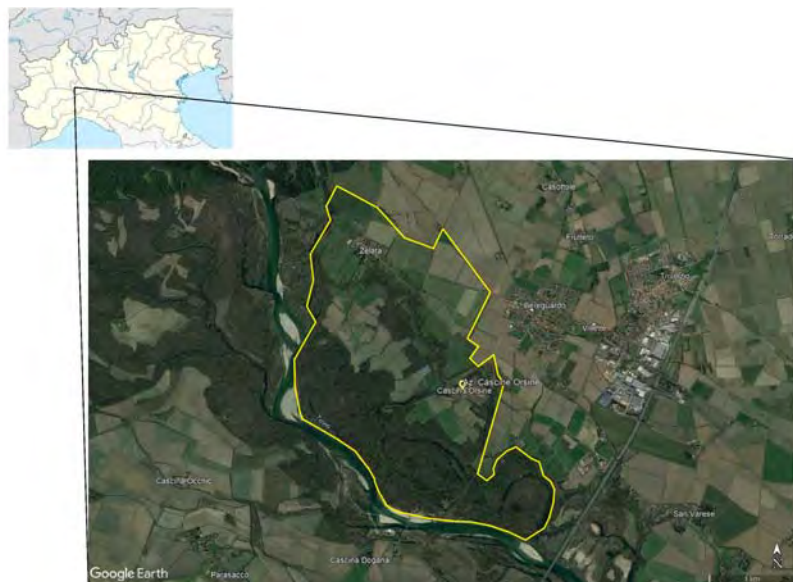
Fig. 1. Localizzazione dell'azienda agricola biodinamica Cascine Orsine, sede dell'evento di bioblitz. In giallo i confini aziendali [immagine elaborata da Wikipedia e da Google Earth].

Fra i mammiferi, negli scorsi decenni, sono ricomparse alcune specie che non erano state più avvistate dalla fine del '700, come ad esempio il capriolo ( Capreolus capreolus ), introdotto più a nord nel Parco del Ticino e che poi ha esteso il suo areale avendo trovato una zona favorevole nei boschi della Zelata, l'area specifica che interessa l'azienda agricola Cascine Orsine (Bogliani, 2004). In quest'area si trovano anche la martora ( Martes martes Linnaeus, 1758), che ha recentemente colonizzato questa porzione di boschi planiziali, e lo scoiattolo rosso ( Sciurus vulgaris Linnaeus, 1758); è assente lo scoiattolo grigio ( Sciurus carolinensis Gmelin, 1788), specie aliena invasiva che, in altre aree della Pianura Padana, esercita una forte pressione competitiva nei confronti dello scoiattolo rosso (Bertolino et al. , 2014). I boschi della Zelata sono