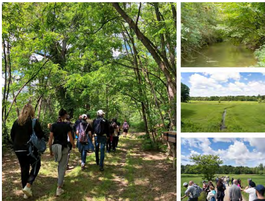
Fig. 2. Immagini di ambienti dell'azienda agricola biodinamica Cascine Orsine e dei partecipanti al bioblitz.

All'evento hanno partecipato 211 persone, di cui 29 bambine e bambini sotto i 14 anni, divise in una decina di gruppi, ognuno accompagnato e guidato nelle osservazioni da un membro della Società di Scienze Naturali del Verbano Cusio Ossola (Fig. 2). Le escursioni dei gruppi nei vari ambienti sia col-