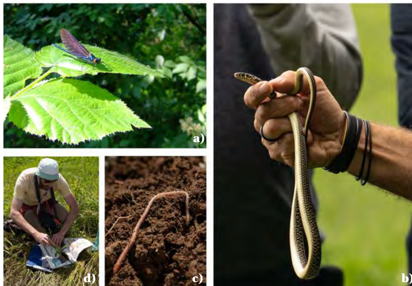
Fig. 4. Immagini di indagini sul campo e di alcune specie di fauna osservate durante il bioblitz. a) Calopteryx virgo ; b) Hierophis viridiflavus ; c) esemplare adulto di Aporrectodea sp. identificato in seguito al microscopio; d) Botanico mentre raccoglie un campione da essiccare per procedere successivamente all'identificazione.

gli stati membri devono attivare misure speciali di conservazione dei loro habitat, per garantirne sopravvivenza e riproduzione nelle loro aree di distribuzione (Tab. III). Pertanto, quest'area assume importanza, per fini conservazionistici, anche a livello europeo. L. pseudacorus , R. sceleratus e R. amphibia appartengono alla categoria C2 della LR 10/2008 "specie di flora spontanea con raccolta regolamentata" e sono presenti in tutto il territorio della Lombardia con il seguente status: da poco frequente a comune ( L. pseudacorus ); raro sui rilievi, più comune in pianura ( R. sceleratus ); raro ( R. amphibia ) (Regione Lombardia, 2010).