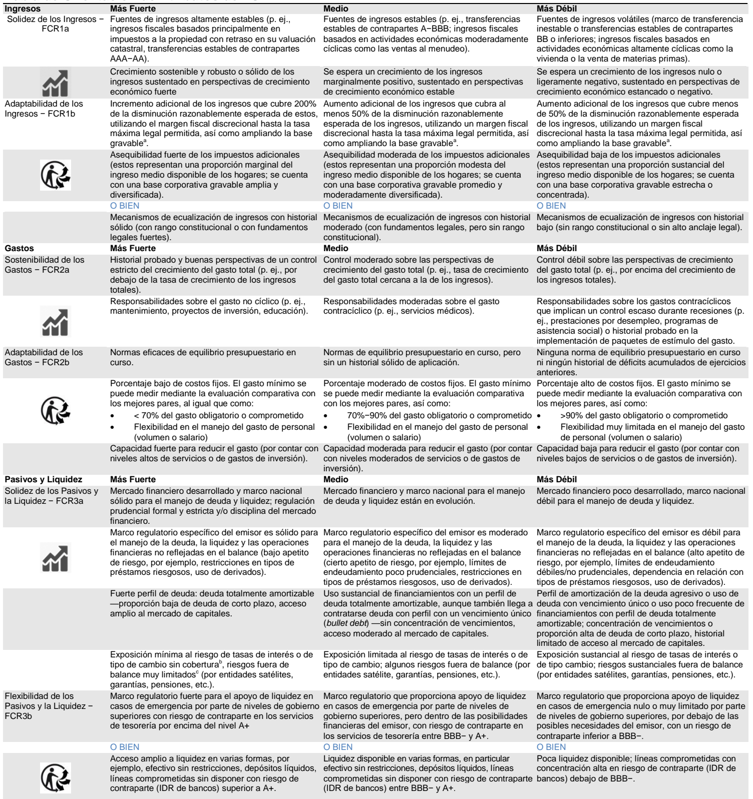
Tabla de Orientación de Atributos de FCR

a Los términos se definen en los párrafos de "Ingresos: Adaptabilidad". b Cubierto con contrapartes acordes con el nivel de atributo (p. ej., mínimo AA– para ser evaluado como Más Fuerte)