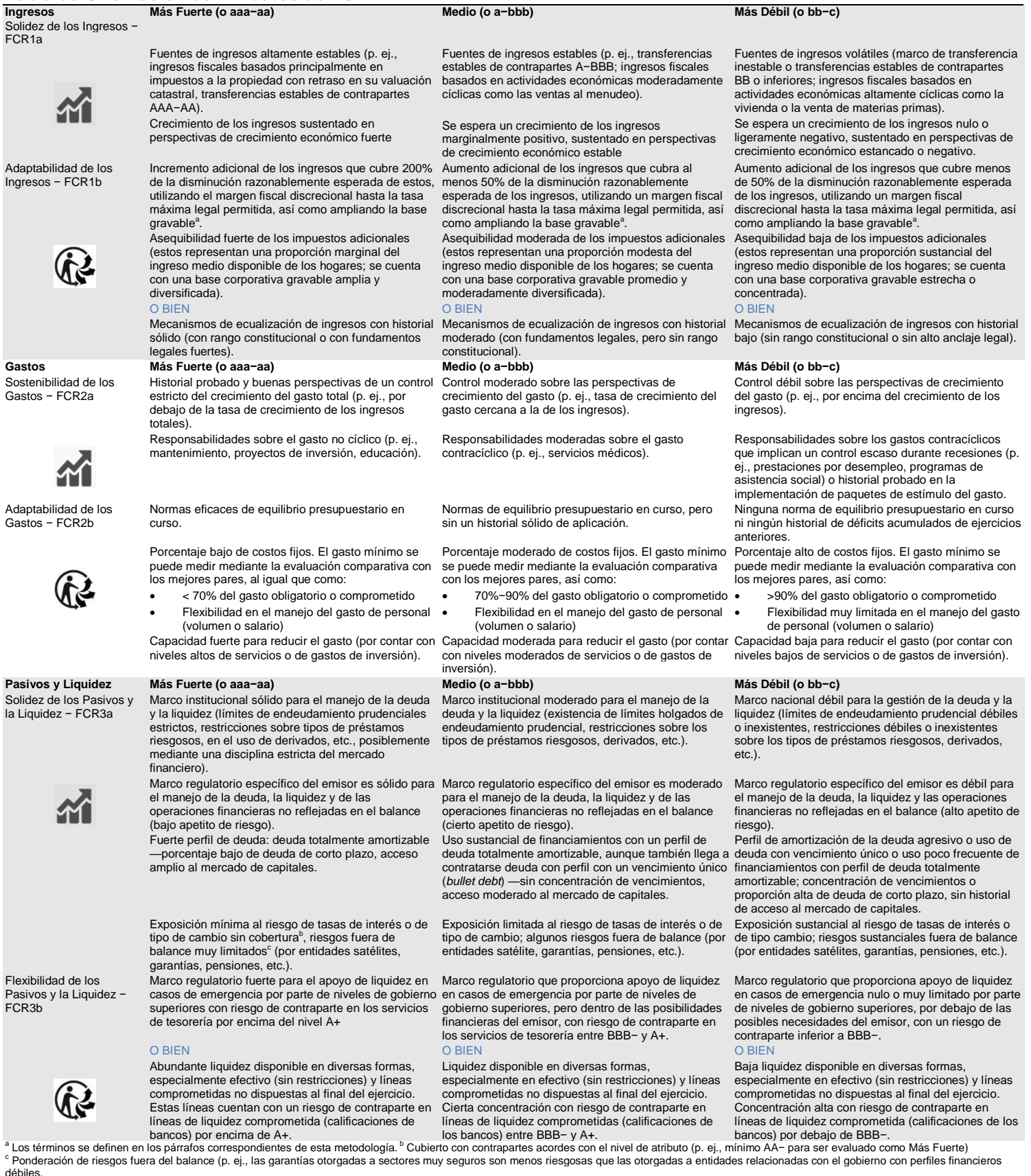
Tabla de Orientación de Atributos de FCR