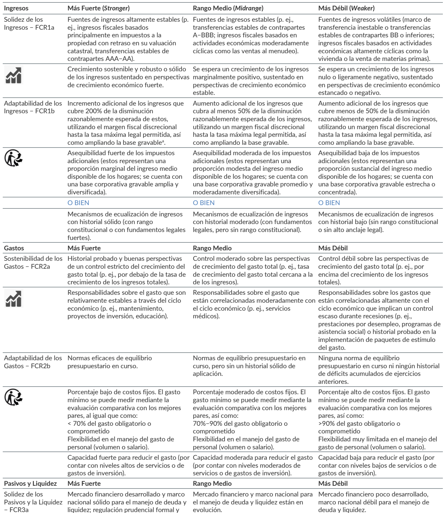
Tabla de Orientación de Atributos de FCR