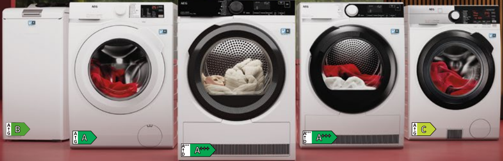
7000 WASCHMASCHINE LTR7A70260