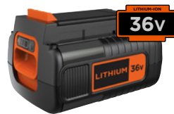
36V 2.0Ah BL20362-XJ