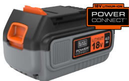
18V 4.0Ah BL4018-XJ