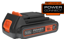
18V 2.0Ah BL2018-XJ