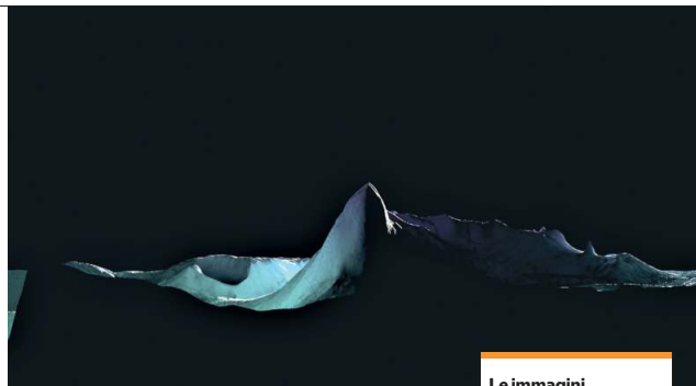
Le immagini A sinistra, due immagini tratte dal film del francese Clément Cogitore sulla "Ferdinanda", in mostra al Museo Madre