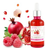
BASE NEUTRE HUILE VISAGE PRÉCIEUSE BIO