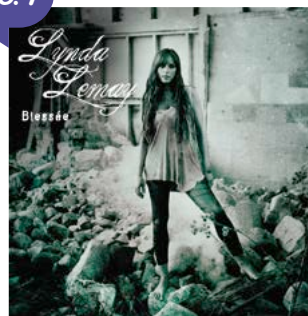
Chanson « Gros Colons - Gros Blaireaux » de Lynda LEMAY, issue de l'album Blessée , 2010.