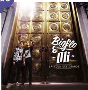
Chanson « Mytho » de BIGFLO & OLI, issue de l'album La Cour des grands , 2016.