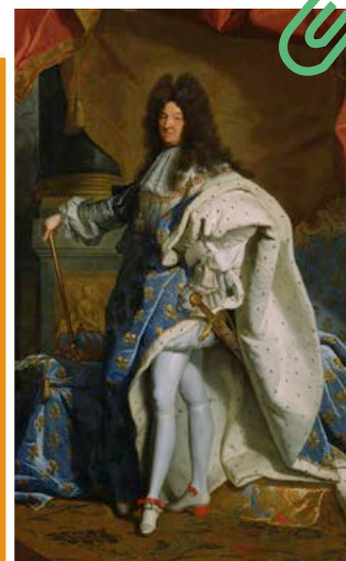
RIGAUD Hyacinthe, Louis XIV, 1701, huile sur toile, 277 x 194 cm, Musée du Louvre, Paris.

Voilà l'un des nombreux mécénats accordés par Louis XIV à un artiste. Ce roi, désireux de rayonner partout en Europe et même au-delà, a choisi de faire de la culture un moyen de s'imposer politiquement. Protecteur des arts au sens large (musique, architecture, littérature, etc.), il a su s'entourer des plus grands : Lully, Molière, Le Brun, etc.