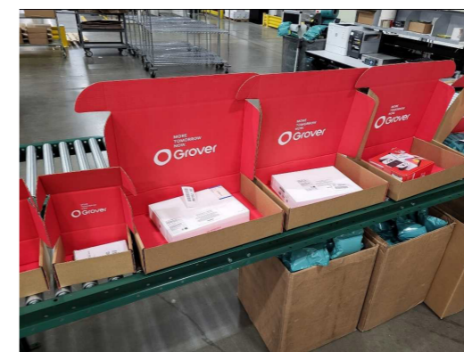
Grover's eerdere verpakking