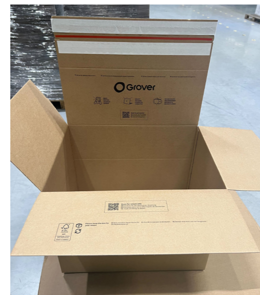
Grover's eerdere verpakking