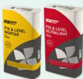
1. Fix & Level Mortar, Fix & Level Ultralight