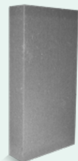
3. Fix & Level Mortar Fix & Level Ultralight