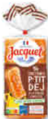
14 TARTINES P'TIT DÉJ À LA FARINE COMPLÈTE SANS SUCRES AJOUTÉS JACQUET 410 g