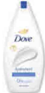
GEL DOUCHE HYDRATANT 0% SULFATE DOVE 450 ml