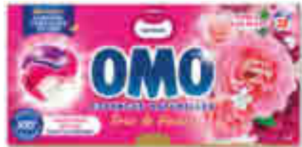
LESSIVE CAPSULES ROSIR DE PLAISIR 3 EN 1 X29 LAVAGES OMO® 502 g