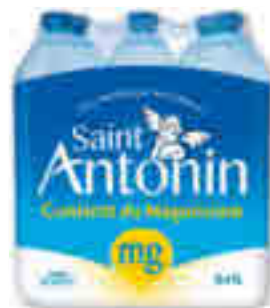
EAU MINÉRALE NATURELLE SANS NITRATES SAINT ANTONIN 6x1l - soit 6 l