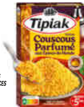
GRAINE COUSCOUS PARFUMÉ AUX ÉPICES DU MONDE TIPIAK 510 g