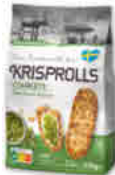
PETITS PAINS SUÉDOIS COMPLÈTS SANS SUCRES AJOUTÉS KRISPROLLS 425 g