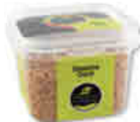
SÉSAME DORÉ LA CONQUÊTE DES SAVEURS 100 g