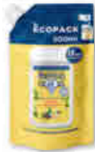
ECOPACK CRÈME DE DOUCHE EXTRA-DOUX LAIT DE VANILLE BIO LE PETIT MARSEILLAIS 500 ml