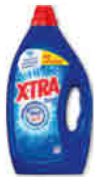
LESSIVE TOTAL TOUT EN 1 X40 LAVAGES XTRA® 1,8 l