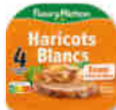
LES TRANCHES VÉGÉ FUMÉES AUX HARICOTS BLANCS FLEURY MICHON 4 tranches - soit 120 g