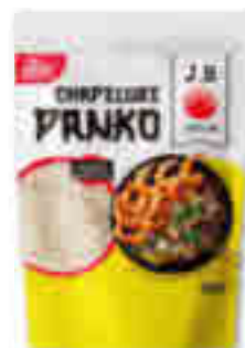
CHAPELURE PANKO J.B. JAPON 200 g