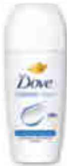
DÉODORANT FEMME BILLE ANTI-TRANSPIRANT CLASSIC DOVE 50 ml