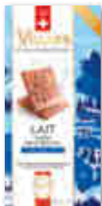
TABLETTE HÉRITAGE 1901 AU LAIT VILLARS 100 g