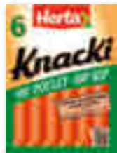
KNACKI 100% POULET HERTA x6 - soit 210 g