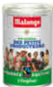
CAFÉ MOULU PUR ARABICA PETITS PRODUCTEURS MALONGO 250 g