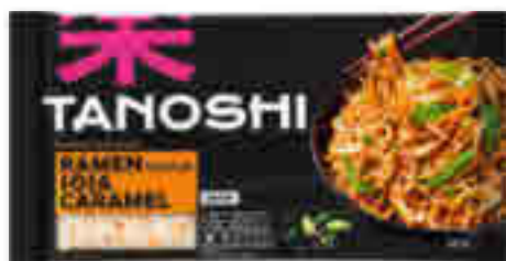
RAMEN SAVEUR SOJA CAMEL TANOSHI 360 g