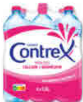
EAU MINÉRALE NATURELLE CONTREX 6x1,5l - soit 9 l