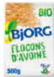
FLOCONS D'AVOINE BIO BJORG 500 g