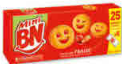
MINI BISCUITS FOURRÉS GOÛT FRAISE BN x5 sachets - soit 175 g