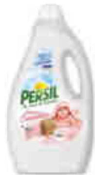
LESSIVE LIQUIDE PEAUX SENSIBLES X43 LAVAGES PERSIL® 1,806 l