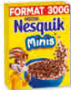
CÉRÉALES NESQUIK MINIS NESTLÉ 300 g