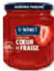
CONFITURE CŒUR DE FRAISE ST MAMET 310 g