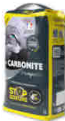
LITIÈRE STOP ODEURS LA CARBONITE TRANQUILLE 5 l