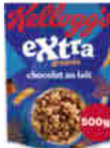
CÉRÉALES EXTRA GRANOLA CHOCOLAT AU LAIT KELLOGG'S 500 g