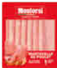
MORTADELLE DE POULET MONTORSI 5 tranches - soit 110 g