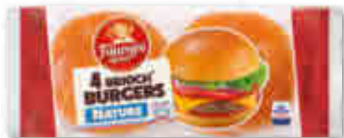
BRIOCH BURGER NATURE X4 LA FOURNÉE DORÉE 250 g