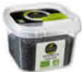
GRAINES DE CHIA BIO LA CONQUÊTE DES SAVEURS 120 g