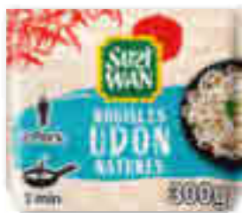
NOUILLES UDON NATURES PRÉCUITES SUZI WAN 2x150g - soit 300 g