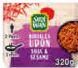
NOUILLES PRÉCUITES UDON SOJA ET SÉSAME SUZI WAN 2x160g - soit 320 g