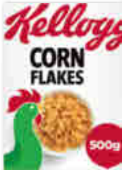
CÉRÉALES ORIGINAL CORN FLAKES KELLOGG'S 500 g