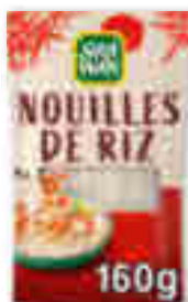
NOUILLES DE RIZ SUZI WAN 160 g