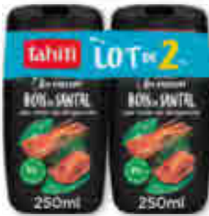
GEL DOUCHE 8H SANTAL ET BERGAMOTE TAHITI 250 ml