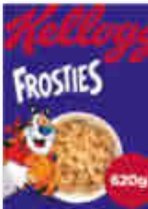
CÉRÉALES FROSTIES KELLOGG'S 620 g