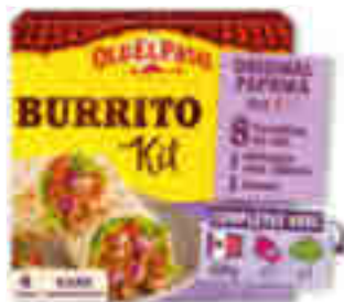
KIT BURRITOS ORIGINAL PAPIKA DOUX OLD EL PASO 510 g