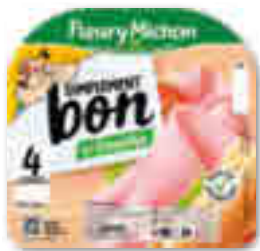
JAMBON SIMPLEMENT BON SANS COUENNE À L'ÉTOUFFÉE FLEURY MICHON 4 tranches - soit 160 g