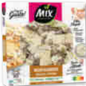
PIZZA DEL GUSTO MONTAGNARDE RACLETTE LARDONS MIX 380 g