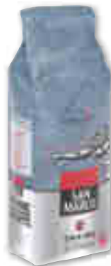
CAFÉ EN GRAINS INTENSITÉ N°7 SAN MARCO 500 g