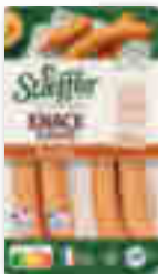
LA KNACK D'ALSACE STOEFFLER 4x55g - soit 220 g