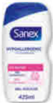
GEL DOUCHE DERMA CARE HYPOALLERGÉNIQUE SANEX 425 ml