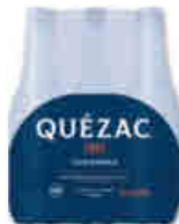
EAU MINÉRALE NATURELLE PÉTILLANTE QUÉZAC 6x1,15 l - soit 6,9 l