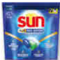
CAPSULES LAVE VAISSELLE 4 EN 1 PRO-EXPERT REGULAR X24 SUN®