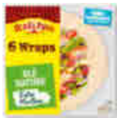
WRAPS DE BLÉ NATURE EXTRA MOELLEUX OLD EL PASO 350 g