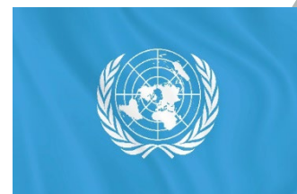
Förenta nationernas flagga.

Fler och fler judar flyttade till Palestina. En del flyttade dit för att de ville, andra för att de var tvungna att fly från sina hemländer. De blev strider mellan judar och araber i Palestina. Några grupper började använda vapen.