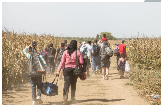
KROATIEN - 19 SEPTEMBER 2015: Flyktingar vandrar genom fälten nära gränsen mellan Kroatien och Serbien, mellan städerna Sid och Tovarnik på Balkanrouten, under flyktingkrisen.

Barnen som tvingas fly har inget med kriget att göra. De var inte med och bestämde att det ska bli krig. Ändå tvingas de lämna sina hem, utan att veta om de någonsin kan komma tillbaka. De kan ofta inte ta med sig sina saker. Ibland måste de skiljas från sina föräldrar eller syskon. Många hamnar i flyktingläger, där det är svårt att leva.