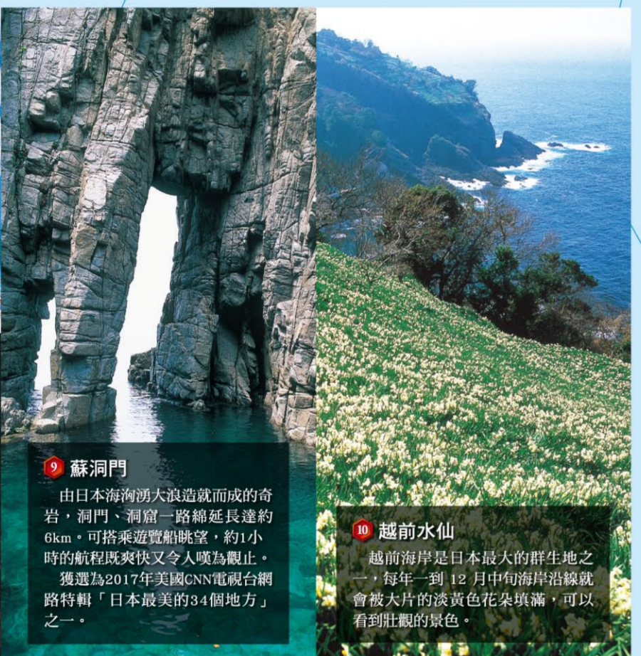
9 蘇洞門 由日本海洶湧大浪造就而成的奇岩，洞門、洞窟一路綿延長達約6km，可搭乘遊覽船眺望，約1小時的航程既爽快又令人嘆為觀止。獲選為2017年美國CNN電視台網路特輯「日本最美的34個地方」之一。