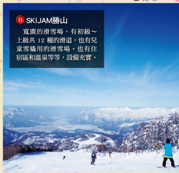
11 SKIJAM勝山 寬廣的滑雪場，有初級~上級共12種的滑道，也有兒童雪橇用的滑雪場，也有住宿區和溫泉等等，設備充實。