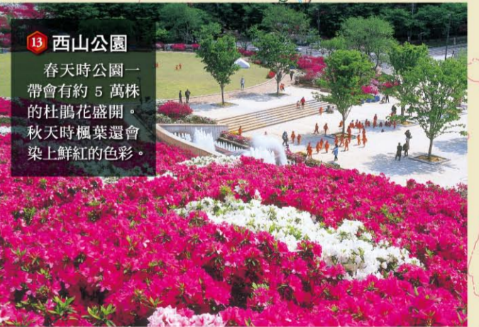
13 西山公園 春天時公園一帶會有約5萬株的杜鵑花盛開，秋天時楓葉還會染上鮮紅的色彩。