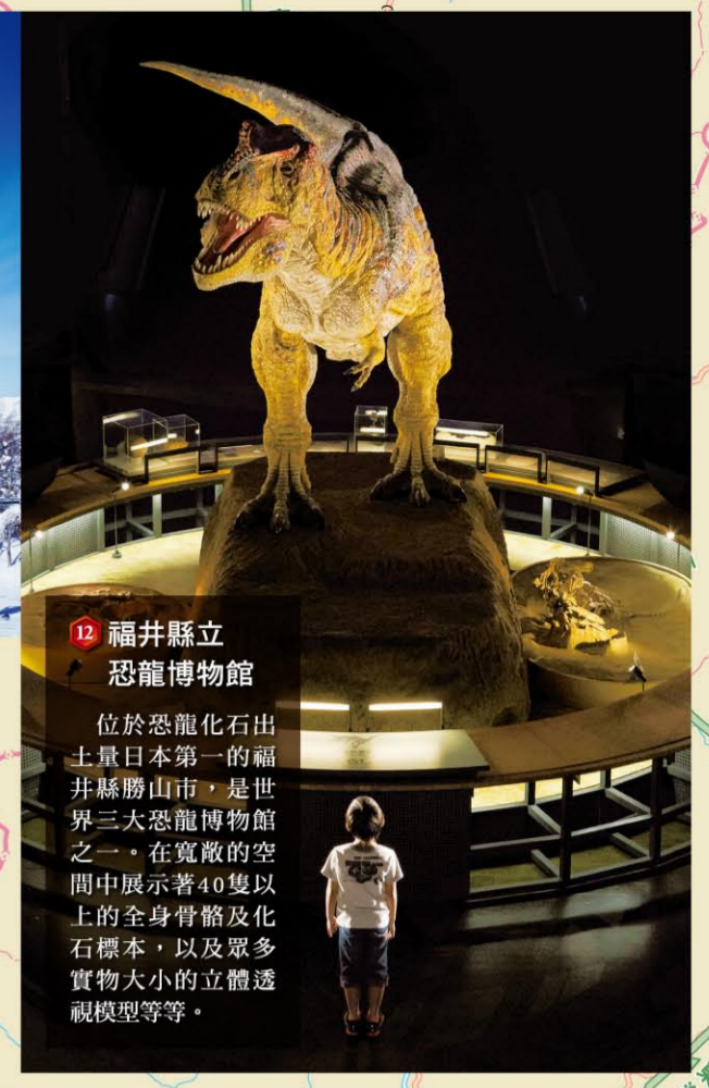
12 福井縣立恐龍博物館 位於恐龍化石出土量日本第一的福井縣勝山市，是世界三大恐龍博物館之一。在寬敞的空間中展示著40隻以上的全身骨骼及化石標本，以及眾多實物大小的立體透視模型等等。