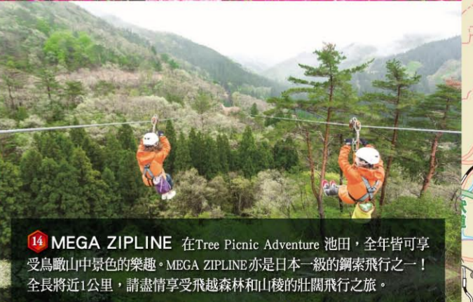
14 MEGA ZIPLINE 在Tree Picnic Adventure 池田，全年皆可享受為難山中翠綠的樂趣，MEGA ZIPLINE亦是日本一級的繩索飛行之一！全長將近1公里，請盡情享受飛越森林和山稜的壯麗飛行之旅。