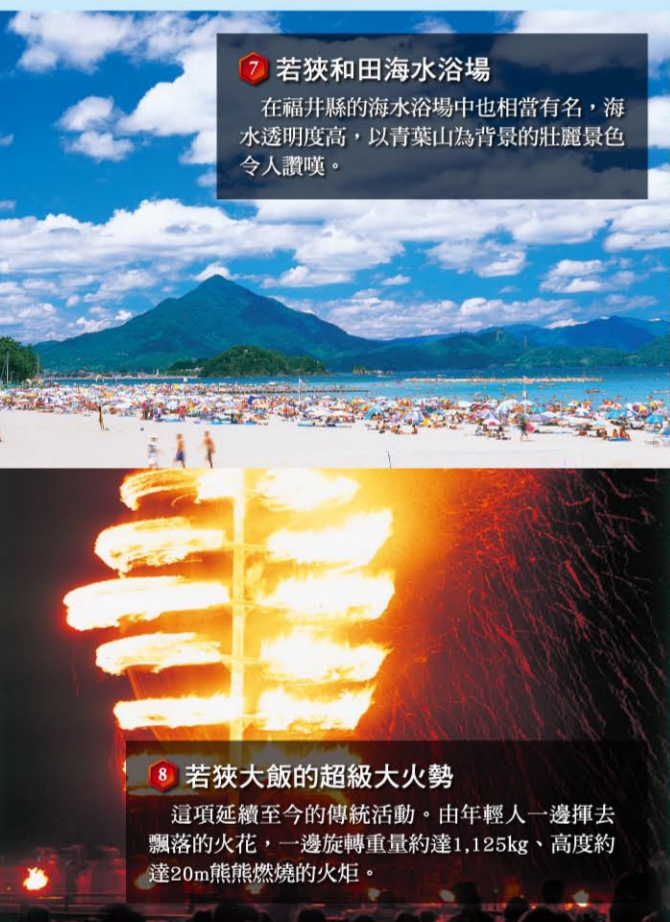
7 若狹和田海水浴場 在福井縣的海水浴場中也相當有名，海水透明度高，以青葉山為背景的壯麗景色令人讚嘆。