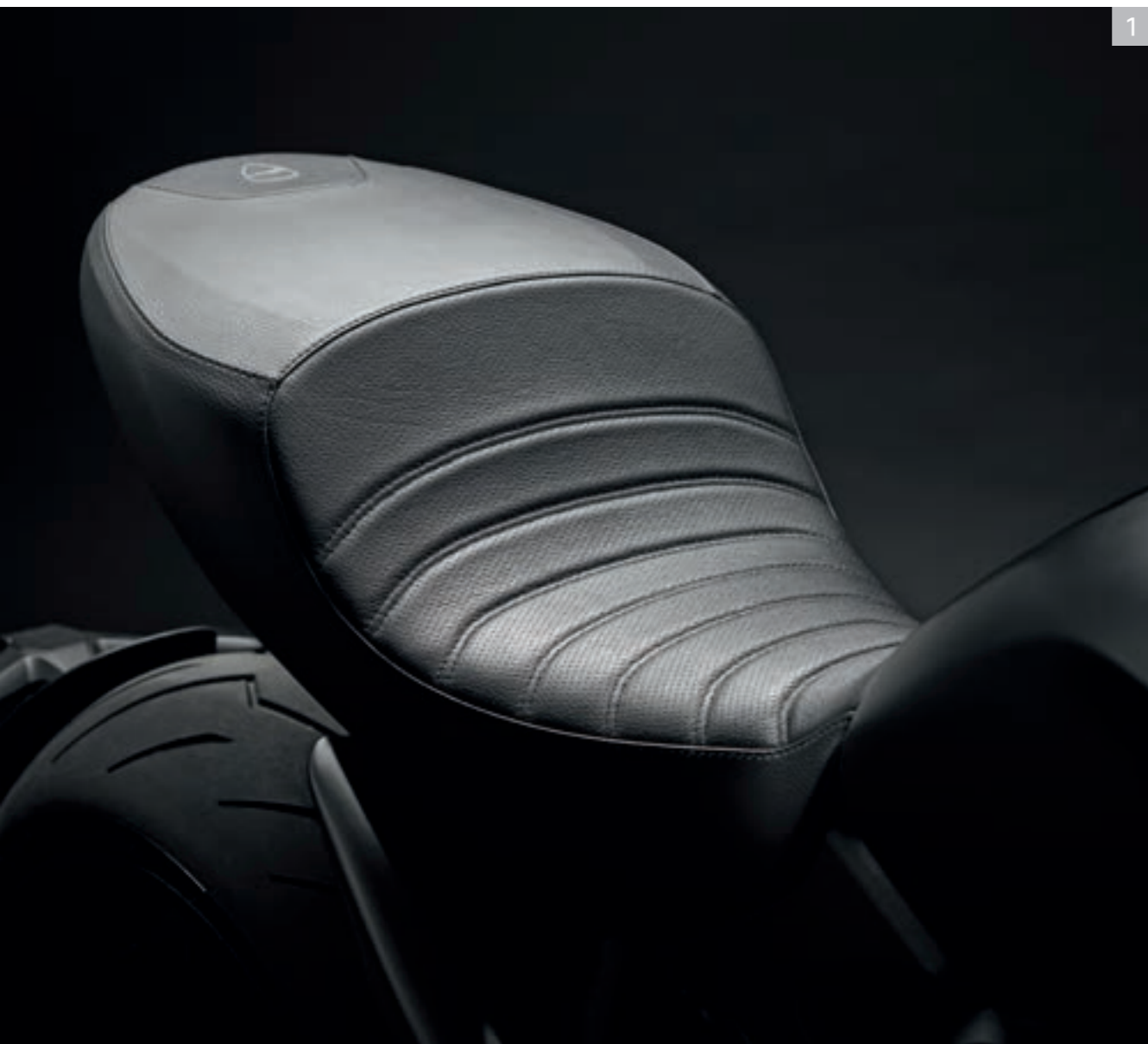
1 Selle Prémium