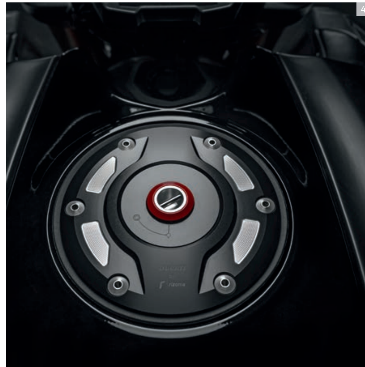
4 Bouchon du réservoir en aluminium usiné dans la masse