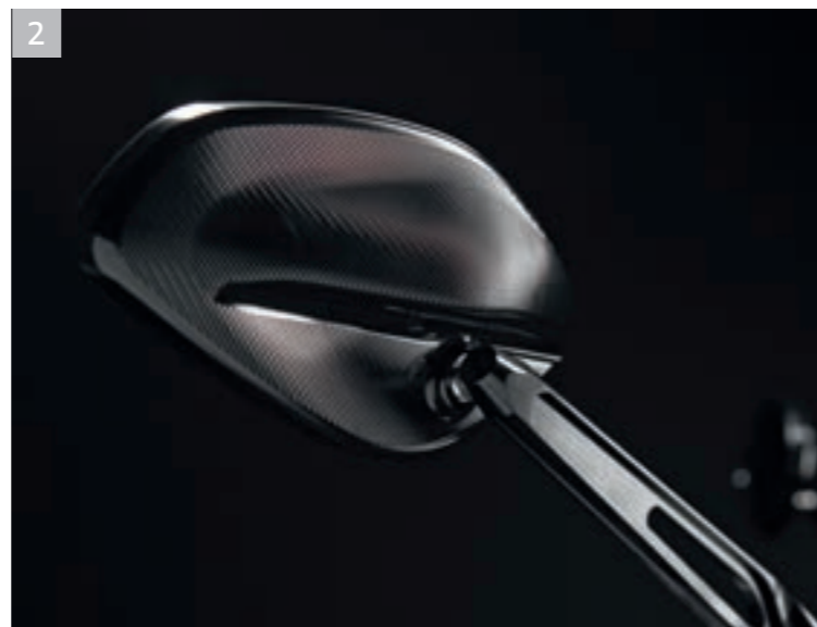
2 Rétroviseurs en aluminium usinés dans la masse OK A ■ ■