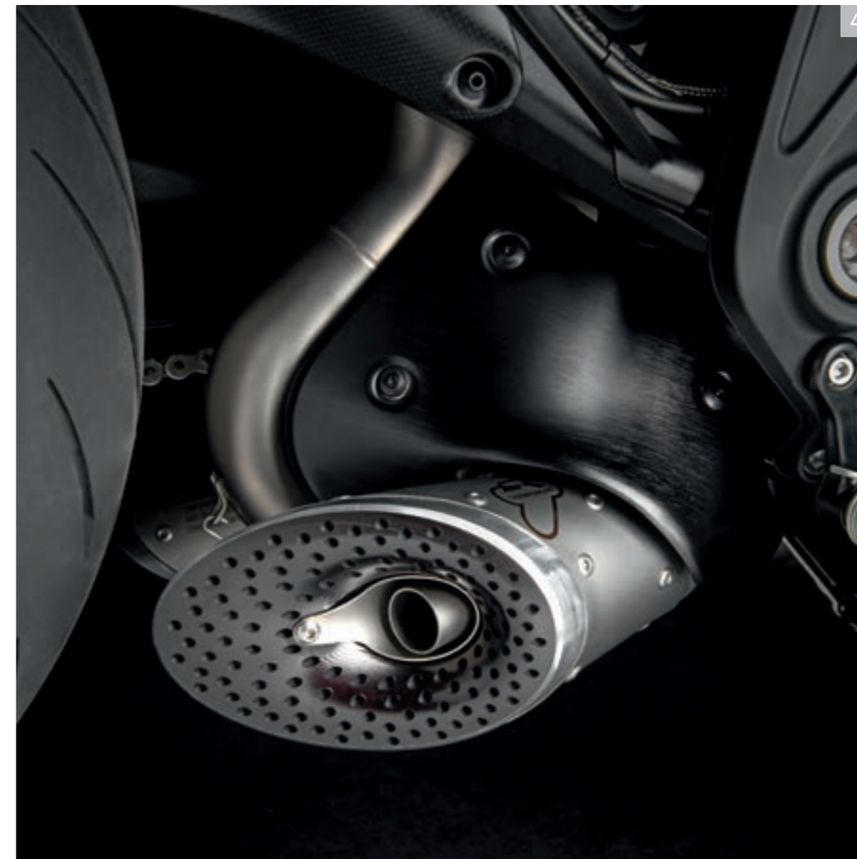
4 Ensemble d'échappement complet