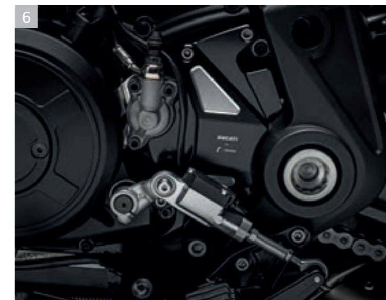
6 Cache pignon en aluminium usiné dans la masse