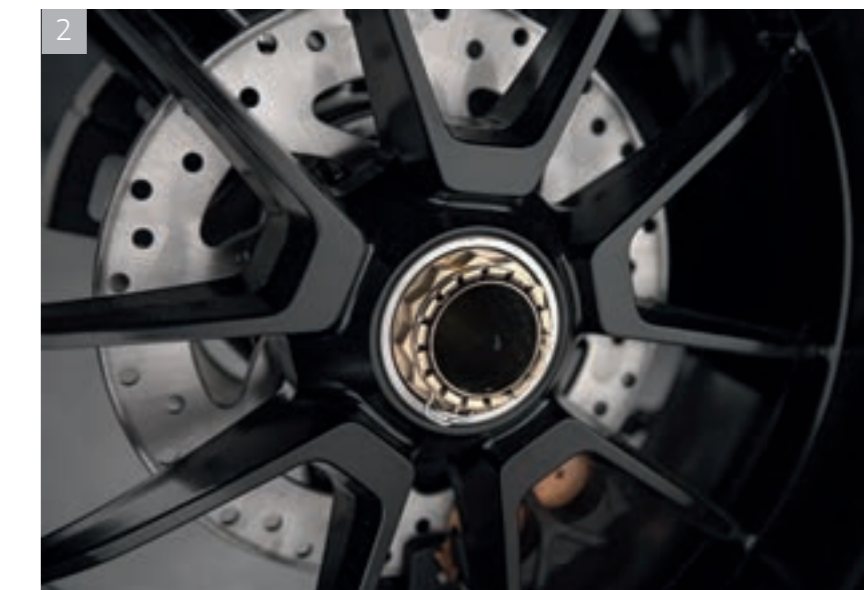
2 Jantes moulée et usinée au design exclusif