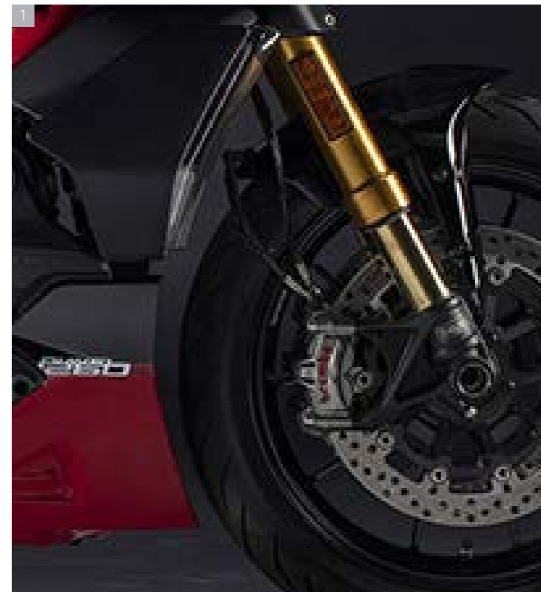
1 Suspensions Öhlins à la finition dorée entièrement réglables à l'avant et à l'arrière