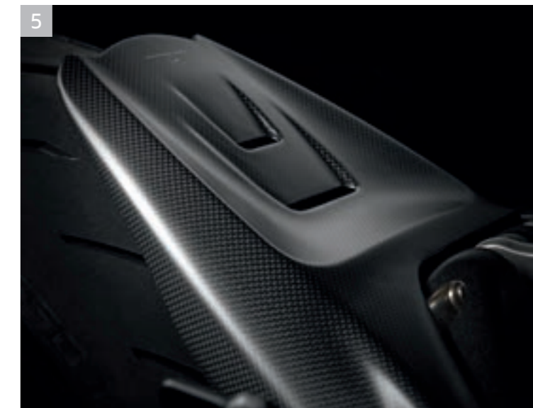
5 Garde-boue arrière en carbone