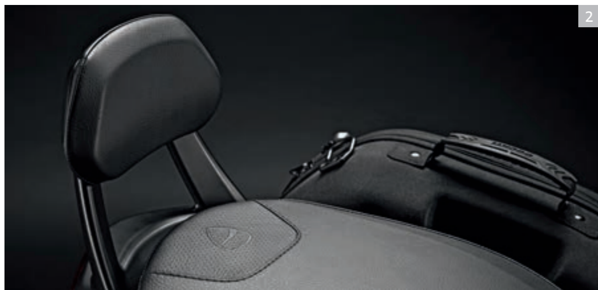
1 Paire de sacs latéraux semi-rigides