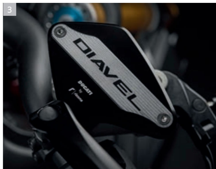
3 Caches pour réservoirs de liquide de frein et d'embrayage A