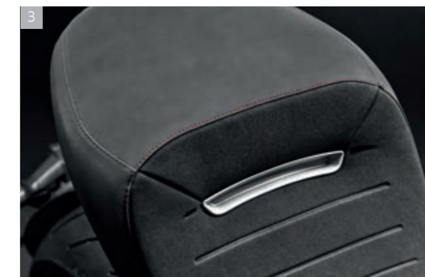
3 Selle Premium avec insert Diavel