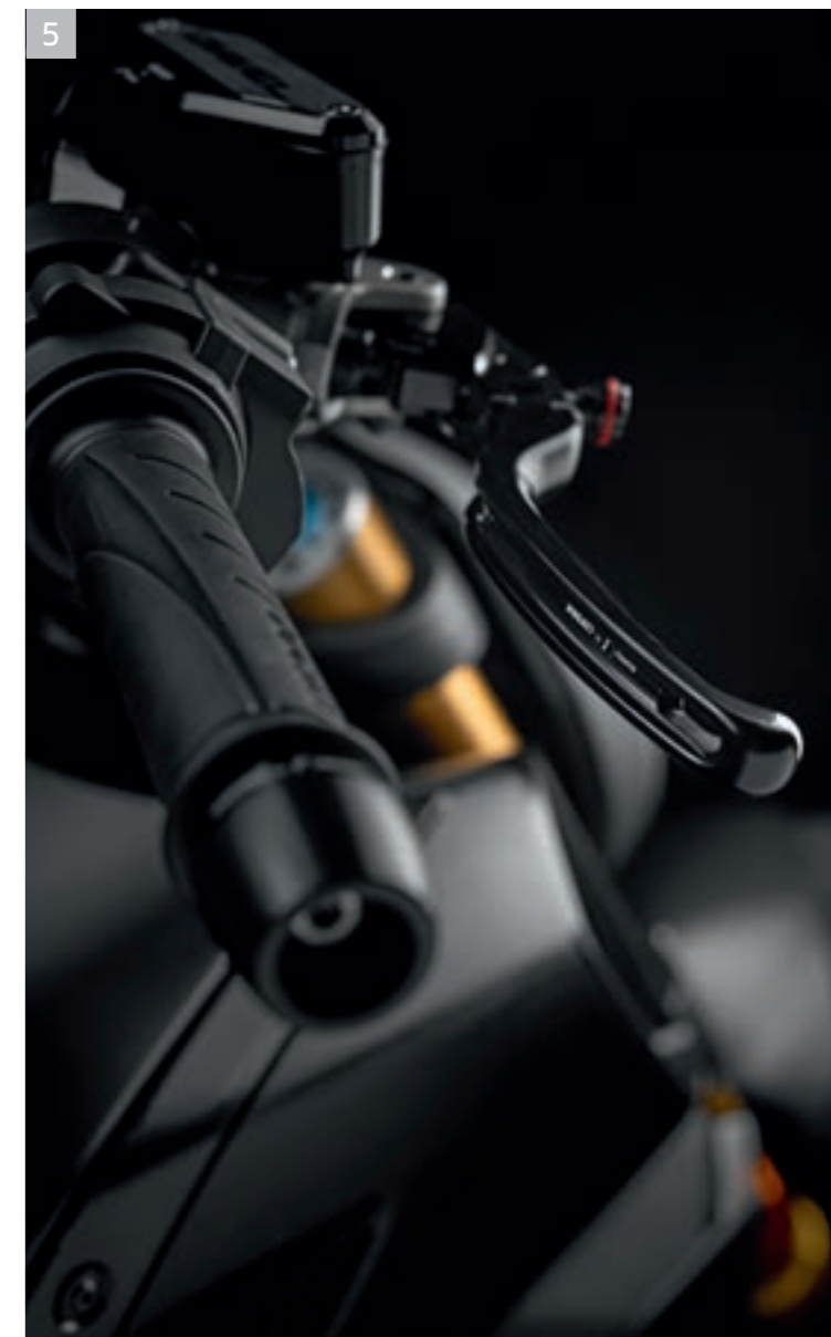
A 5 Levier de frein A