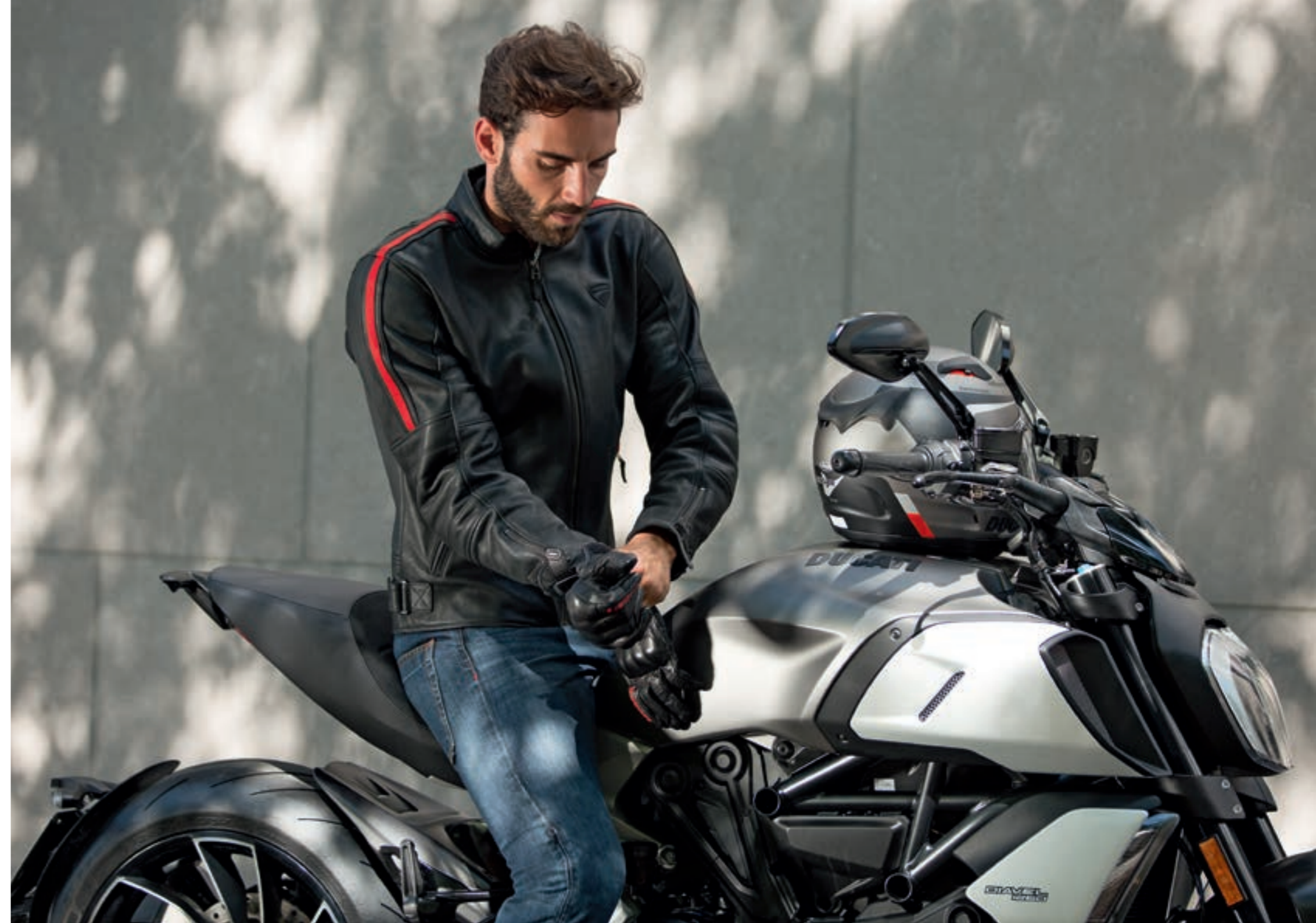
Logo C1 Gants en cuir