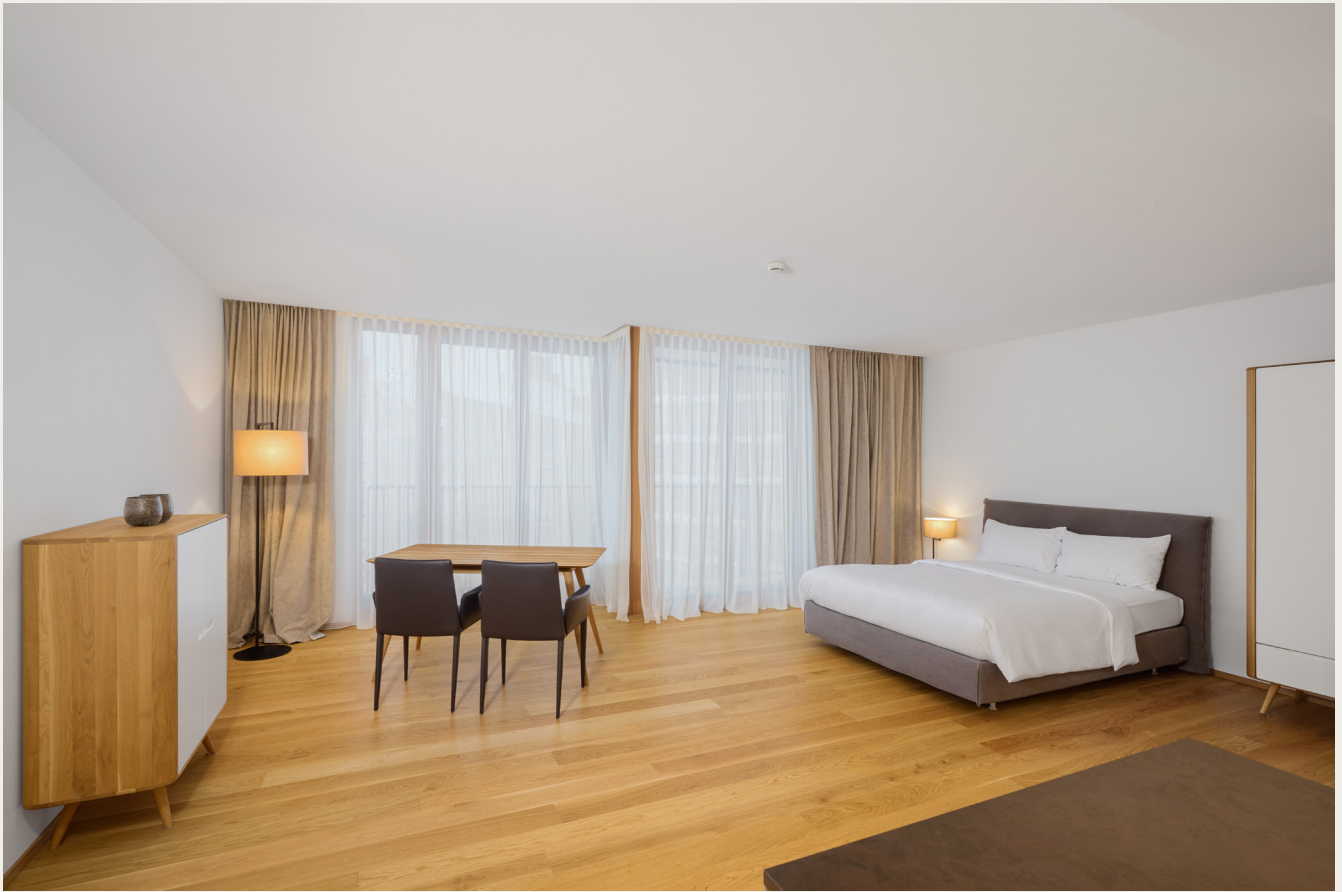
Wohnbereich und Esszimmer