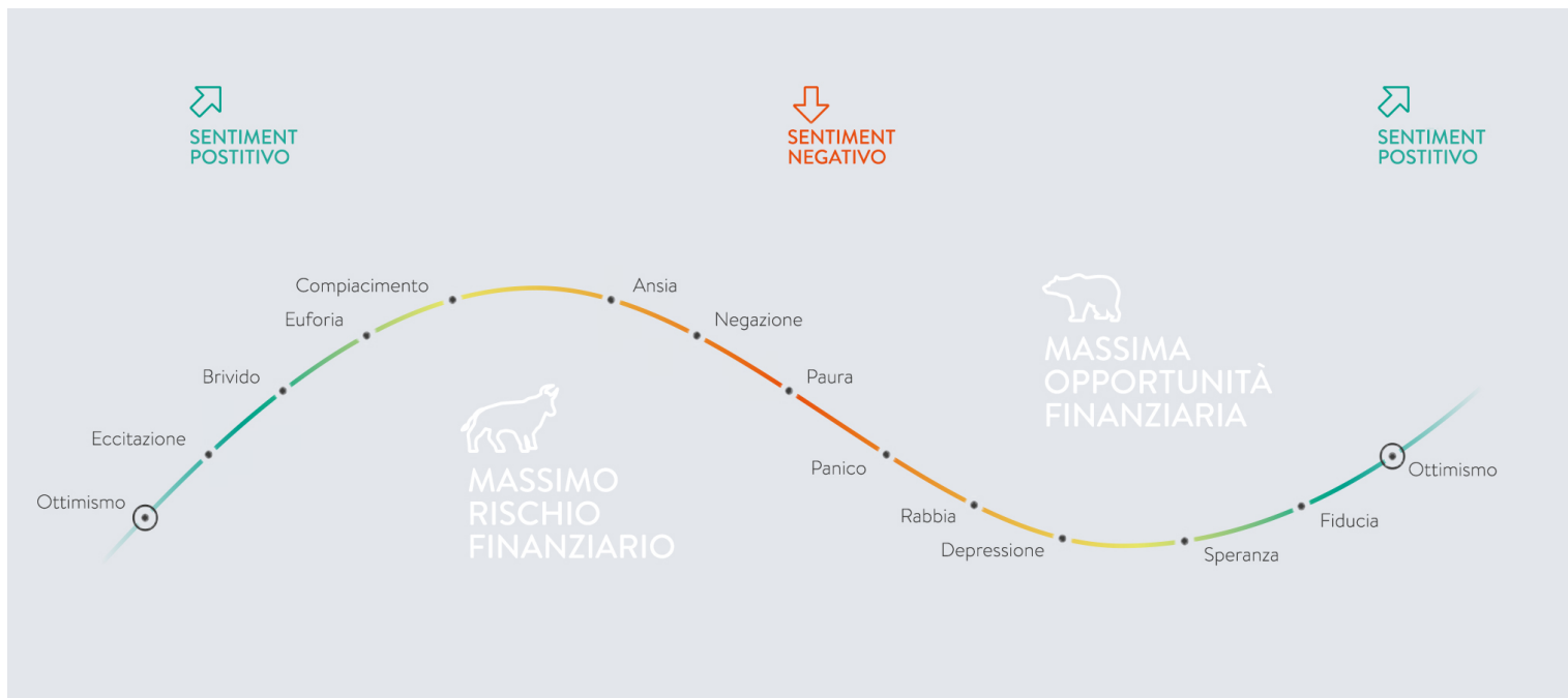
Fig 1: Il "sentiment" è fondamentale per i mercati

Intuitivamente diremmo che si tratta di economia, politica o banche centrali: questo è ciò che è più ovvio e di cui i media parlano. Ma, in realtà, le cose sono un po' più complicate.