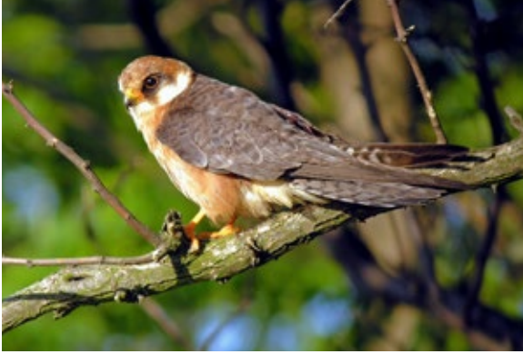
Rotfußfalke Weibchen ( Falco vespertinus ), Parndorfer Platte/Burgenland, 27.6.2010.