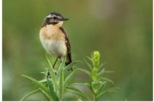
Braunkehlchen Männchen ( Saxicola rubetra ), Hanság/Burgenland, 30.6.2017.