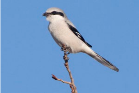
Raubwürger ( Lanius excubitor ), Seewinkel/Burgenland, 5.11.2009.