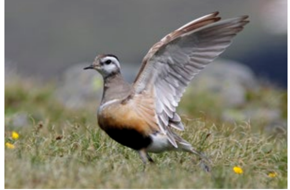
Mornellregenpfeifer Weibchen ( Charadrius morinellus ), Nockberge/Kärnten, 19.6.2014.