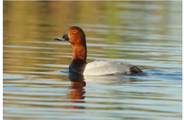
Tafelente Männchen ( Aythya ferina ), Seewinkel/Burgenland, 20.5.2014.