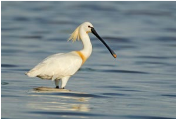
Löffler ( Platalea leucorodia ), Seewinkel/Burgenland, 18.5.2014.