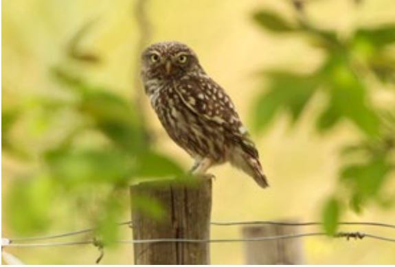
Steinkauz ( Athene noctua ), Seewinkel/Burgenland, 4.6.2016.