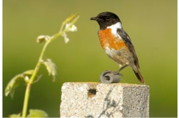
Schwarzkehlchen Männchen ( Saxicola rubicola ), Seewinkel/Burgenland, 7.6.2014.