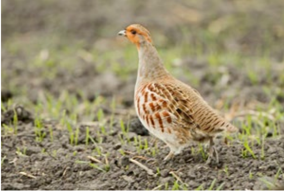
Rebhuhn Männchen ( Perdix perdix ), Seewinkel/Burgenland, 29.11.2015.