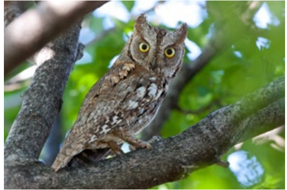
Zwergohreule ( Otus scops ), Kroatien, 27.5.2010.