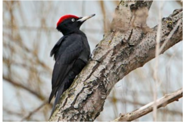
Schwarzspecht Männchen ( Dryocopus martius ), Donauinsel/Wien, 4.2.2013.