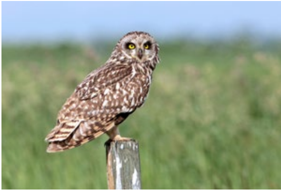
Sumpfohreule ( Asio flammeus ), Hanság/Burgenland, 31.5.2015.