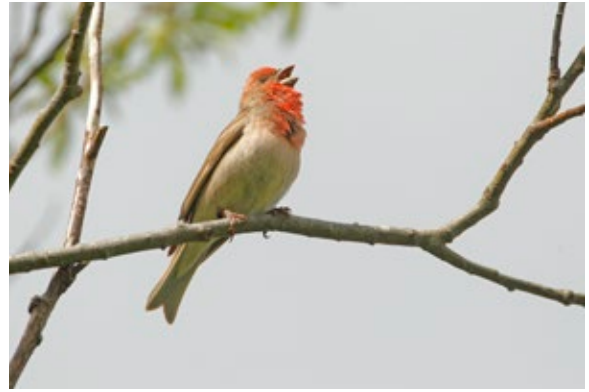
Karmingimpel Männchen ( Carpodacus erythrinus ), Hubertussee/Niederösterreich, 31.5.2014.