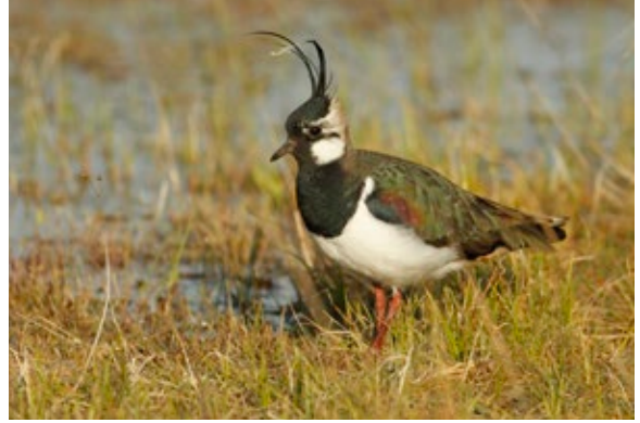
Kiebitz ( Vanellus vanellus ), Seewinkel/Burgenland, 12.4.2015.