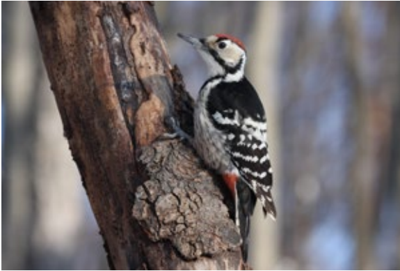
Weißrückenspecht Männchen ( Dendrocopos leucotos ). Traisen/Niederösterreich, 16.2.2010.