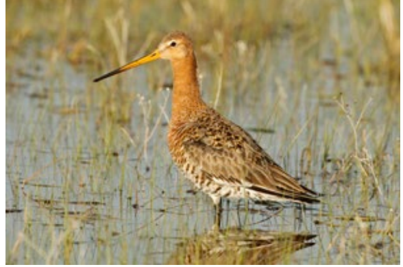
Uferschnepfe ( Limosa limosa ), Seewinkel/Burgenland, 10.4.2015.