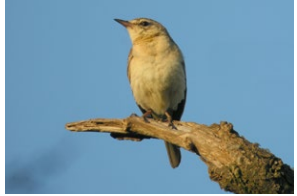
Brachpieper ( Anthus campestris ), Parndorfer Platte/Burgenland, 27.6.2010