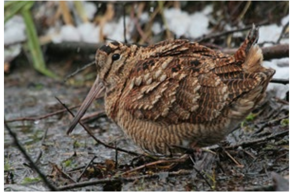
Waldschnepfe ( Scolopax rusticola ), Wörgl/Tirol, 4.12.2013.