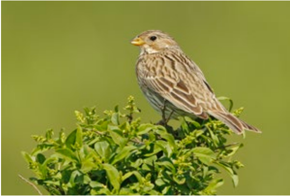
Grauammer ( Emberiza calandra ), Seewinkel/Burgenland, 7.5.2015.