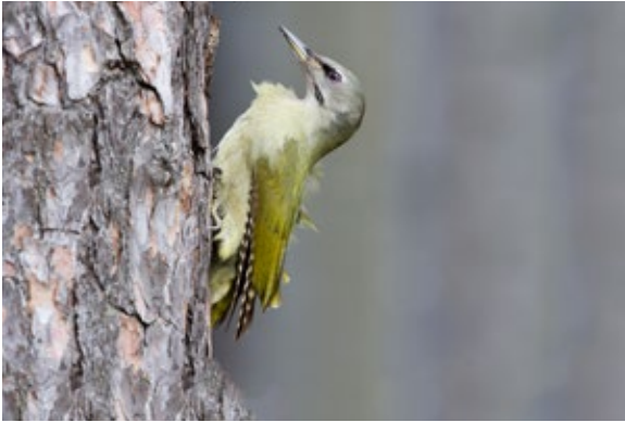
Grauspecht ( Picus canus ) Traisen/Niederösterreich, 25.2.2012.