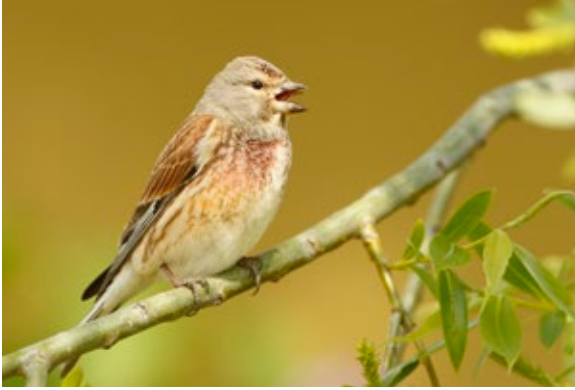
Bluthänfling Männchen ( Carduelis cannabina ), Seewinkel/Burgenland, 19.4.2014.