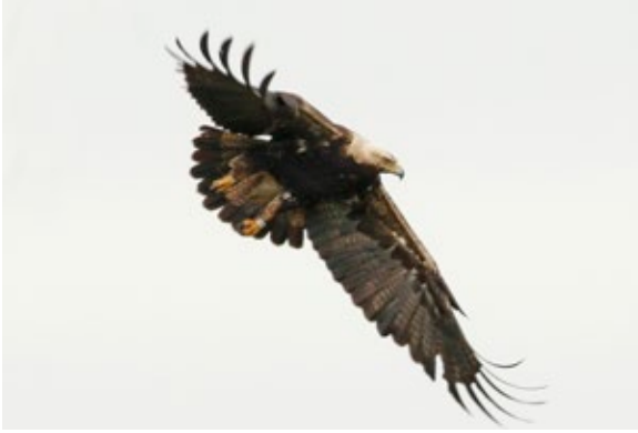
Kaiseradler adult ( Aquila heliaca ), Hanság/Burgenland, 3.7.2016.