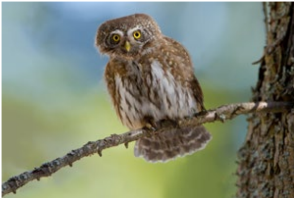
Sperlingskauz ( Glaucidium passerinum ), Wenigzell/Steiermark, 16.3.2013.