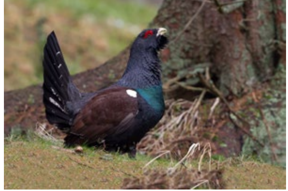
Auerhuhn Männchen ( Tetrao urogallus ), Fischbacher Alpen/Steiermark, 12.4.2014.