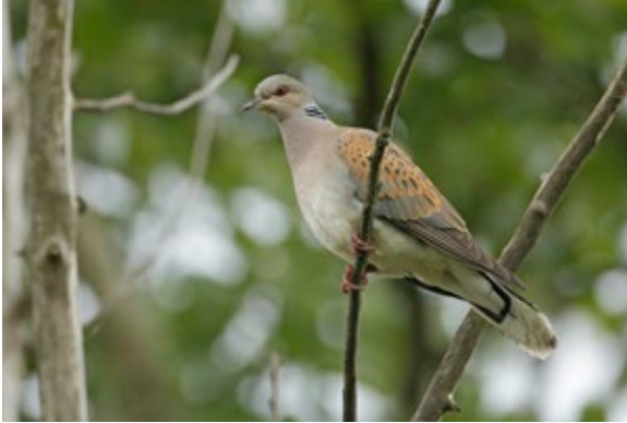
Turteltaube ( Streptopelia turtur ), Seewinkel/Burgenland, 19.5.2014.