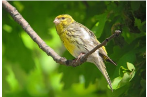
Girlitz ( Serinus serinus ), Seewinkel/Burgenland, 9.5.2016.