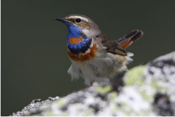
Rotsterniges Blaukehlchen Männchen ( Luscinia s. svecica ), Kärnten, 1.7.2010.