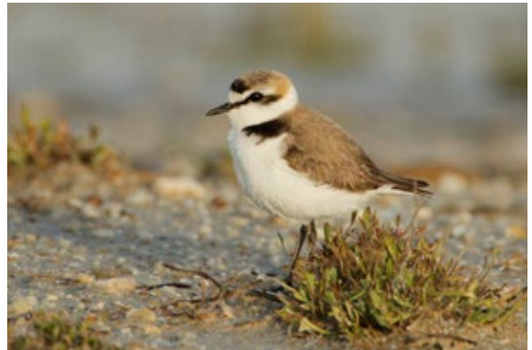
Seeregenpfeifer Männchen ( Charadrius alexandrinus ), Seewinkel/Burgenland, 19.5.2014.