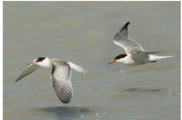
Flusseeschwalbe adult und juvenil ( Sterna hirundo ), Seewinkel/Burgenland, 20.7.2014.