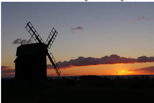
Gettlinge Gravfält.