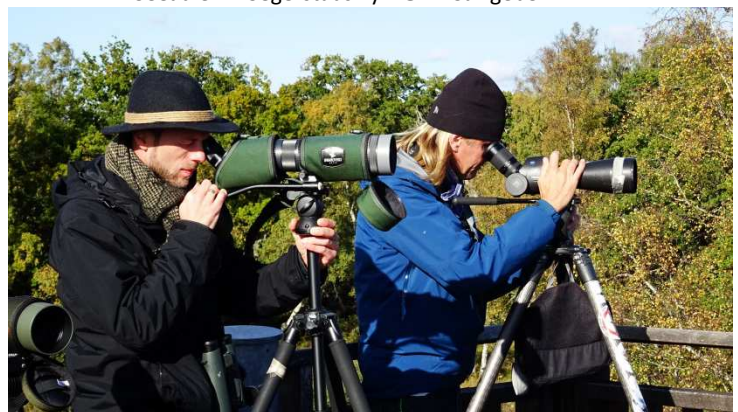
Die Reiseleiter bei der Arbeit.