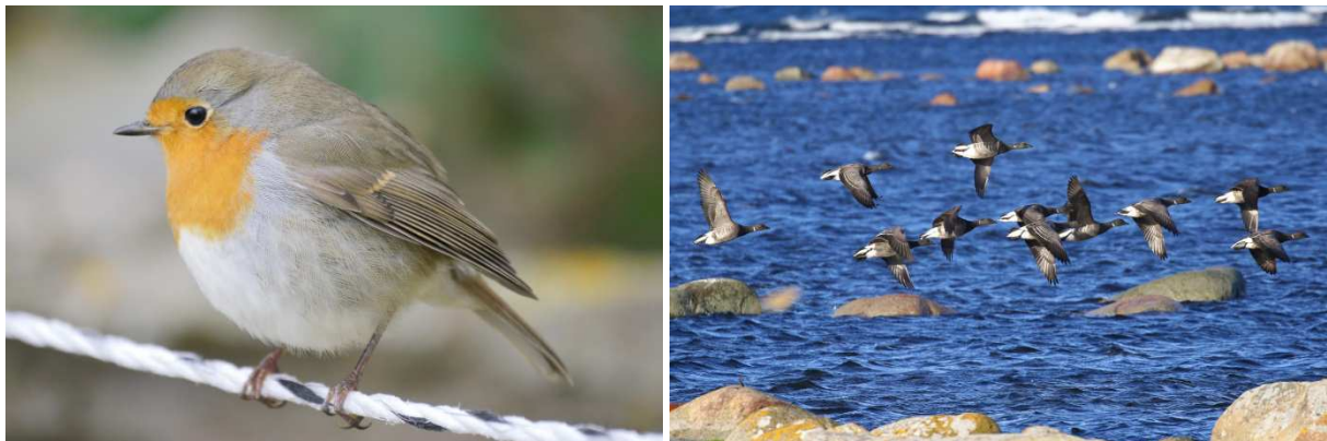
Rotkehlchen und Ringelgänse.

Etwa zu Mittag brechen wir nach Norden auf. Gejausnet wird auf der Fahrt, nur Kaffee und Tee gibt es erst nach unserer Ankunft in Beijershamn an der Westküste Ölands. Bei dem anschließenden Spaziergang durch das Naturreservat sind wir dem starken Wind voll ausgesetzt. Trotzdem ist dieses Gebiet für uns sehr lohnend, denn hier sehen wir die ersten Zwergschwäne . Diese sind wohl frisch aus der Tundra eingetroffen, denn es sind die ersten, die diesen Herbst auf Öland beobachtet werden. Sie lassen sich sehr gut mit den ebenfalls anwesenden Singschwänen und Höckerschwänen vergleichen. Weiters sehen wir Kanadagänse , Graugänse , Weißwangengänse und viele hundert Gründelenten, darunter ein großer Trupp mit mindestens 80 Spießenten . Weiter draußen auf einer Sandbank wären noch etliche Vögel zu sehen gewesen, doch der starke Wind macht ein Bestimmen unmöglich. Da wir vor dem Abendessen noch ein wenig Zeit haben, fahren wir nach Nedra Västertstad bei Bjärby. Hier gibt es ein Vogel- und Robbenschutzgebiet, und im letzten Licht des