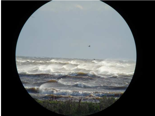
Das typische Wetter dieser Reise.