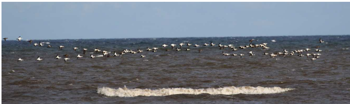
Ziehende Eiderenten beim Segerstads Fyr.

Der Wind hat kräftig aufgefrischt und bläst mit etwa 45 km/h aus Nordost. Das sind – nach einer Durststrecke von gut einem Monat – ideale Bedingungen für den Vogelzug. Wir erleben einen außerordentlich starken Zug von Enten und Gänsen: An diesem Nachmittag ziehen ca. 11.000 Weißwangengänse und etwa 2.000 Ringelgänse über unsere Köpfe hinweg nach Südwest! Einige Male sind kleinere Kranichtrupps dabei, die durch den gewaltigen Rückenwind heute sogar mit der Geschwindigkeit der Gänse mithalten können. Weiter draußen am Meer ziehen im Lauf des Nachmittags etwa 15.000 Eiderenten nach Süden – bei jedem Blick in die Ferne ist mindestens ein Trupp zu sehen. Auch Spießenten ziehen, ebenso weit draußen am Meer Trauerenten, Seetaucher und Lappentaucher . Direkt an der Küste sehen wir verschiedene Limikolenarten recht nah. Nach einer kurzen, wetterbedingten Pause in Christians Wohnzimmer besteigen wir den Leuchtturm, von wo aus ein Trupp Singschwäne beobachtet werden kann. Wir bleiben bis 18 Uhr und fahren dann schließlich – rückwärts – knapp eineinhalb Kilometer den Feldweg zurück zur Straße. Nach etwa 20 Minuten erreichen wir unser Quartier, den Allégården in Kastlösa. Nach einem feinen Abendessen und der Listenerstellung im gemütlichen Rezeptionshaus sind alle froh bald ins Bett zu kommen.