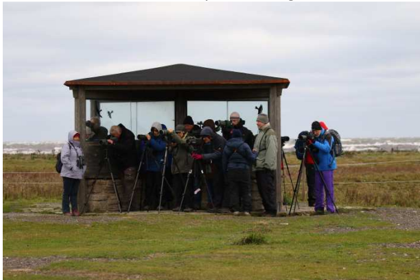
Windschutz ist gut.