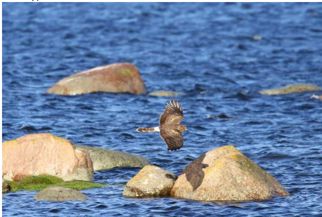
Kornweihe in Ottenby.