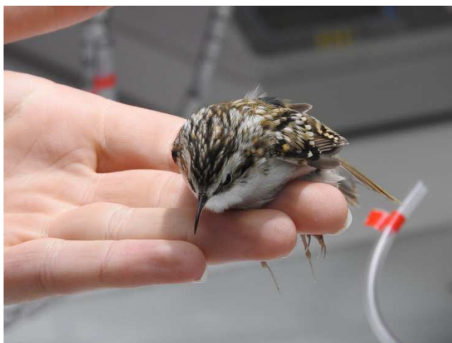
Waldbaumläufer ssp. familiaris beim Beringen.

Wir besichtigen die Helgoland-Reusenfalle und können beim Beringen zusehen. Anschließend treffen wir Christian wieder, der mit uns den Nachmittag verbringt. Nach einer kurzen Runde zur Südspitze beim Leuchtturm fahren wir ein paar 100 Meter nach Norden zum Södra Lundén . Bei der Mittagspause mit Kaffee und Tee sehen wir Rotmilan , Seeadler , Kornweihe und Wanderfalke . Von hier spazieren wir durch die offene Buschlandschaft um rastende Kleinvögel zu finden – unter anderem Singdrossel und einen „ Trompetergimpel “ Über Södra Lundspetsen gehen wir zum Lundsjön , der