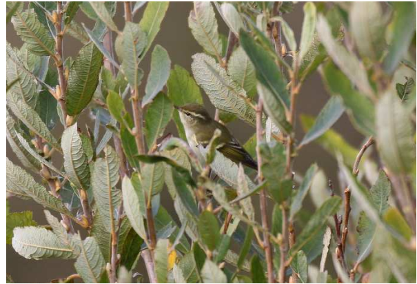
Zwergammer und Gelbbrauen-Laubsänger, zwei Stars dieser Reise.

Zunächst machen wir Mittagspause bei Ventlinge an der Westküste der Insel. Das Jausnen und Kaffeetrinken wird jäh unterbrochen von einem Gelbbrauen-Laubsänger , der von Iris fotografiert wurde. Der Vogel erweist sich als äußerst schwer zu sehen, obwohl er anscheinend die meiste Zeit im gleichen Busch verbringt. Nach einigem Hin und Her, inklusive Wiederfund durch schwedische Beobachter, hat ihn etwa die halbe Gruppe kurz zu Gesicht bekommen. Wir fahren schließlich weiter nach Norden. In Stenåsa machen wir Halt bei Naturbokhandeln, dem größten Shop für Vogelbeobachter in Schweden – und der ist witzigerweise mitten im Nirgendwo auf Öland. Hier gibt es neben Toiletten spannende Produkte für viele der ReiseteilnehmerInnen. Dann geht es weiter zum nahe