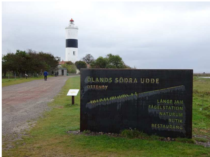
Die Südspitze Ölands, ein Mekka für Vogelbeobachter.

Um acht Uhr starten wir mit dem Bus Richtung Süden. Nach etwa 30 Minuten erreichen wir Ottenby an der Südspitze Ölands. Weite, von Rindern beweidete Flächen erstrecken sich bis zur Südspitze, wo neben dem Leuchtturm nur wenige Gebäude stehen. Hier beobachten wir etliche Entenarten und zahlreiche ziehende Vögel: die ersten Raufußbussarde , Sperber und einen Wanderfalken , sowie Ringeltauben und Dohlen in Trupps mit über 100 Vögeln. In den wenigen Gehölzen rasten zahlreiche Kleinvögel, besonders Rotkehlchen und Wintergoldhähnchen