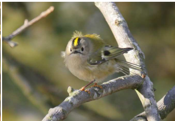
Wintergoldhähnchen überall.