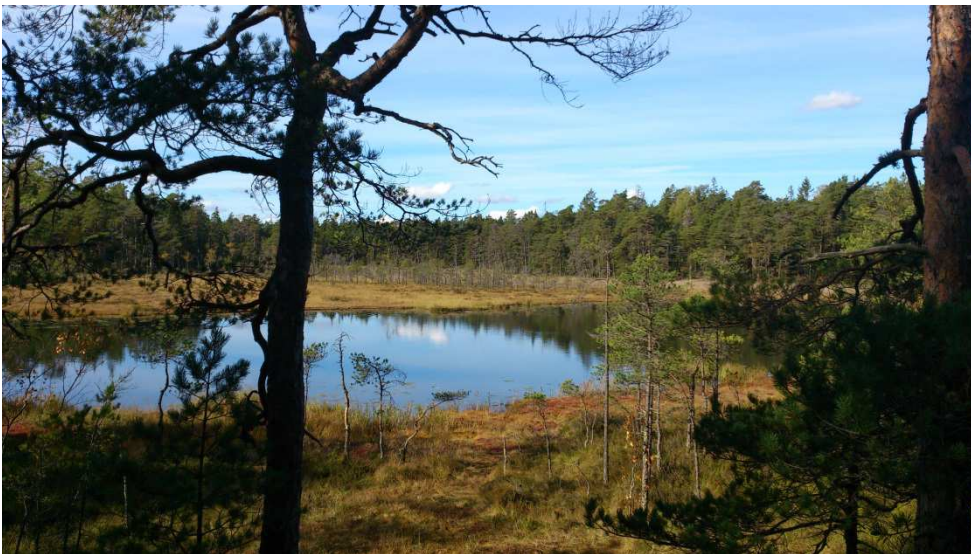
Årsjötjällen im Tyresta Nationalpark.

Der größere Teil der ReisetilnehmerInnen trifft sich am frühen Morgen am Flughafen Wien Schwechat. Überpünktlich landen wir kurz vor neun Uhr in Stockholm Arlanda, wo wir die TeilnehmerInnen treffen, die bereits früher bzw. via Zürich angereist sind. In Stockholm ist es wolkenlos aber kühl (Morgentemperatur null Grad!). Am Flughafen erwartet uns unser Busfahrer Ulf mit einem Reisebus, in den auch eine doppelt so große Gruppe locker hineingepasst hätte. Da sonntags wenig Verkehr ist, fahren wir durch die Stockholmer Innenstadt nach Süden, sodass wir einen kurzen Eindruck von der Stadt bekommen.