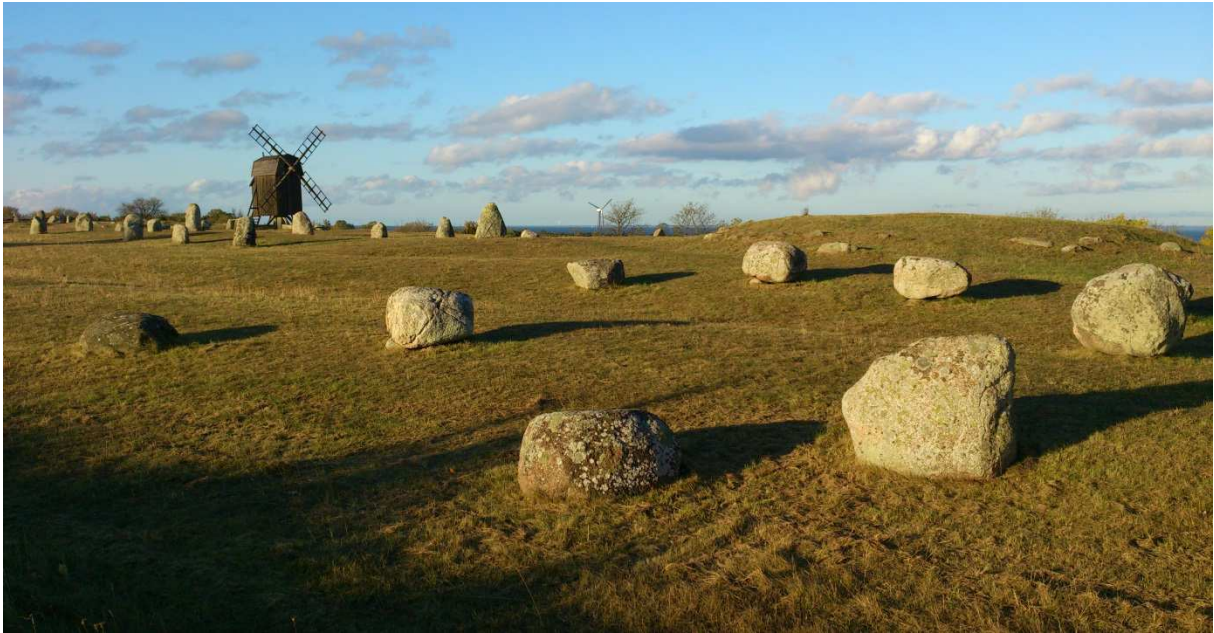
Gettlinge Gravfält © N. Teufelbauer