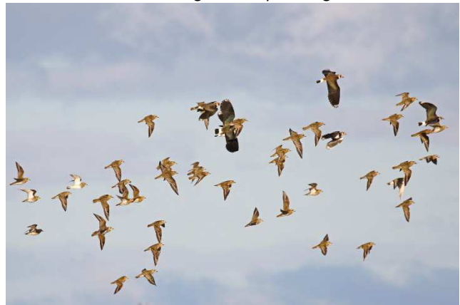
Kiebitze und Goldregenpfeifer.