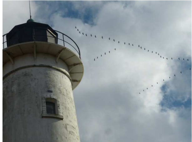
Ziehende Kraniche am Segerstads Fyr.