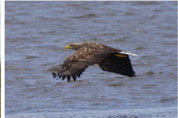
Seeadler in Segerstads Fyr.