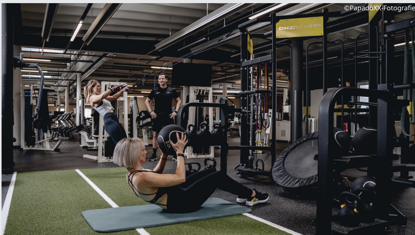
Das Gym Fitness World bietet Training auf großer Fläche zum Beispiel an neusten Geräten.