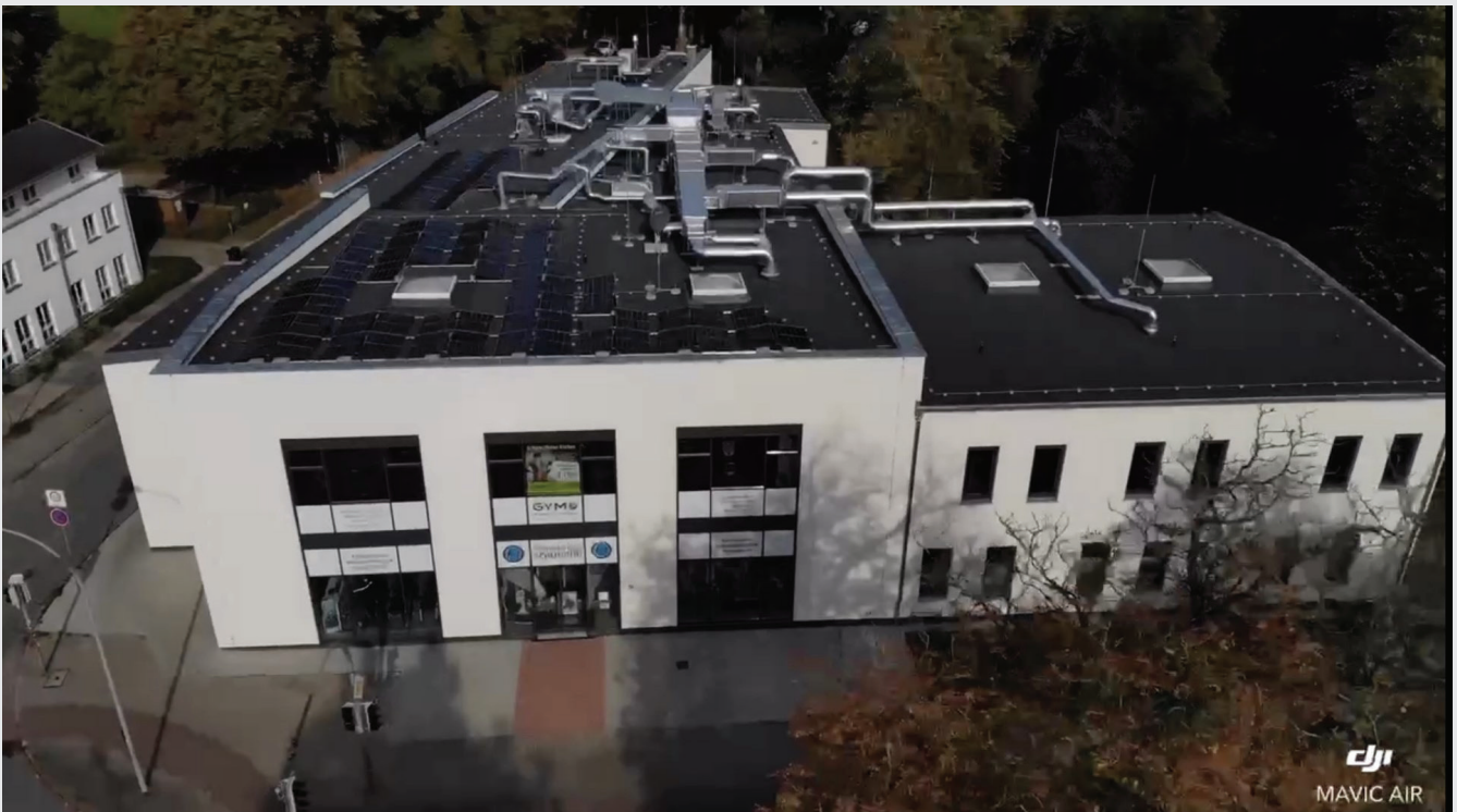
Das im Jahr 2020 eigens für Gym Fitness World fertiggestellte Gebäude am Knieperdamm 5, 18435 Stralsund von oben.

suchen und diese zu beschaffen. Die zuverlässige Belieferung ermöglicht es Gym Fitness World, sich auf ihre Kernkompetenzen zu konzentrieren und ihre Produkte und Dienstleistungen erfolgreich zu entwickeln.