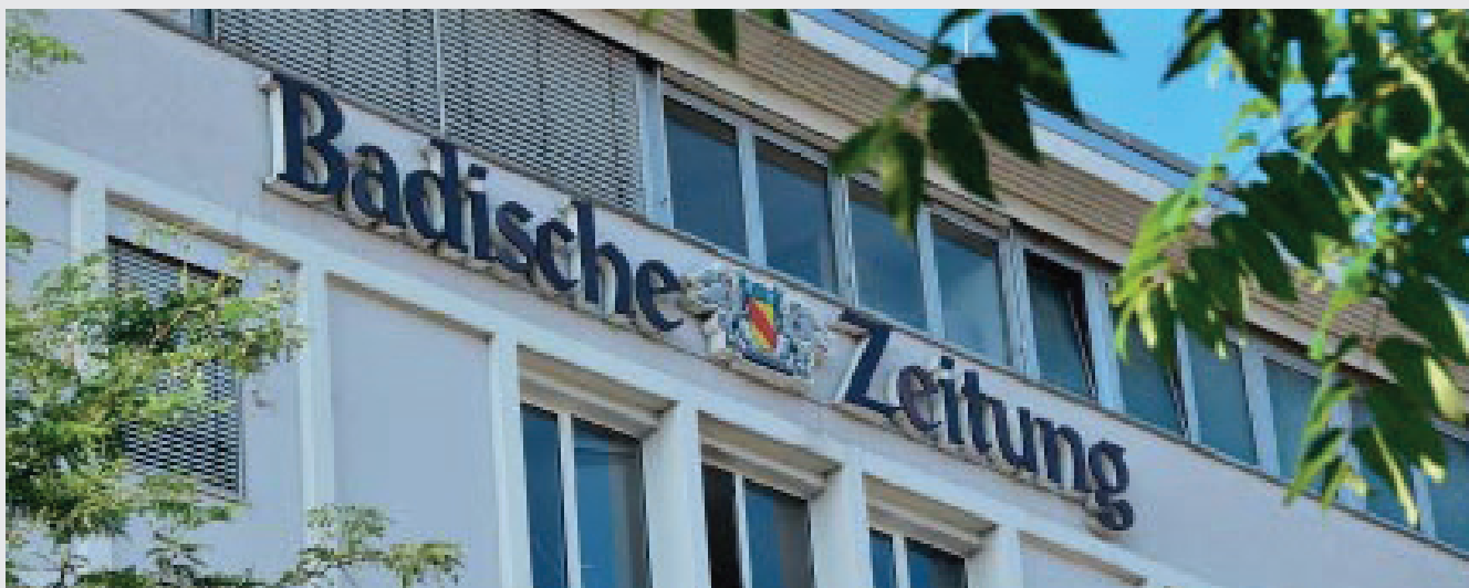
Im südbadischen Freiburg findet sich die Redaktion der traditionsreichen Badischen Zeitung.

Um regional immer am Puls der Zeit und objektiv im Geschehen zu sein, ist die BZ in den Gemeinden vielfach aktiv und engagiert. Der Verlag initiiert und unterstützt zum Beispiel die Leseförderung in Schulen, beteiligt sich an sozialen Initiativen und sponsert regelmäßig Kulturveranstaltungen, auf die diese erhalten bleiben.