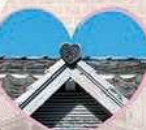
这儿竟还有点心彩瓦!