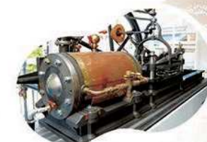
富冈制丝厂开设期间使用的蒸汽机“法国式缫丝机”的复原机。