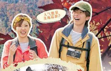
人气爆棚 圣地巡礼

妙义山是与赤城山、榛名山并称上毛三山的名山。白云山、金洞山、金鸡山为“表妙义”，谷急山、丁须之头、御岳等为“里妙义”，陡峭奇石林立的山形被列为日本三奇胜之一。石门群、大泡岩等大自然创造的神秘风景展现眼前，尤其是春天的新绿和樱花、秋天似火的红叶，点缀着群山，美不胜收。