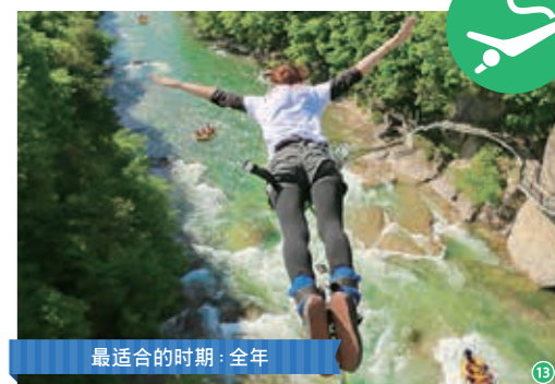
最适合的时期：全年