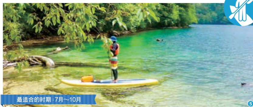
最适合的时期：7月~10月