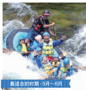
最适合的时期：5月~6月