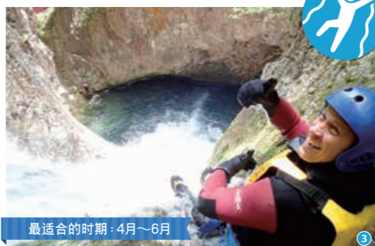
最适合的时期：4月~6月

乘坐大型充气橡皮艇，时而在急流中穿行，时而顺流而下，感受急流的力量。在利根川的源头领略它的美丽。