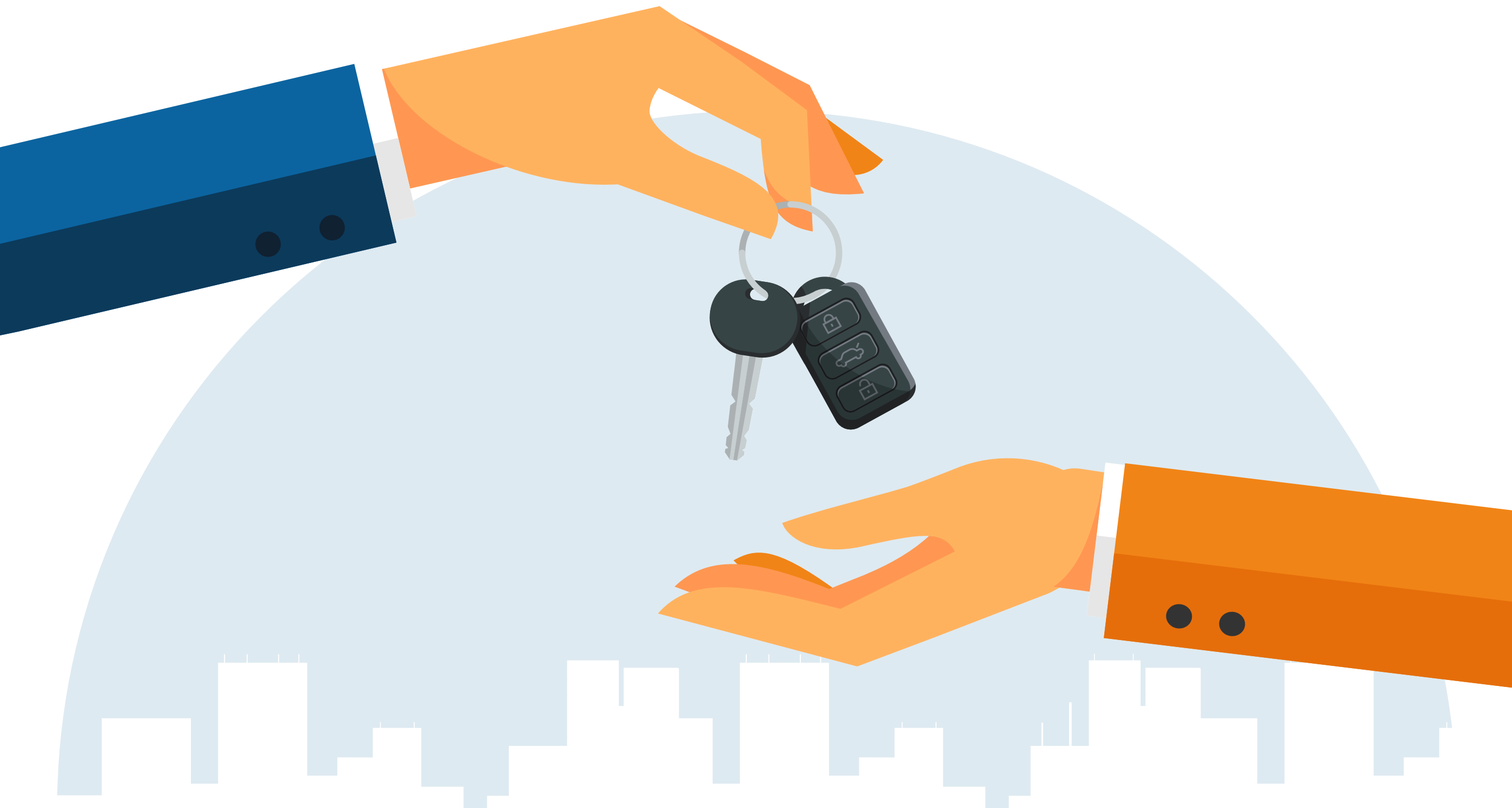
TAVOLA PERIODICA PER L'ACQUISTO DELLA TUA AUTO USATA