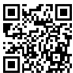
ミータスログイン画面

決済システム「MiiT+(ミータス)」を利用して、研修会参加費の支払いをお願いいたします