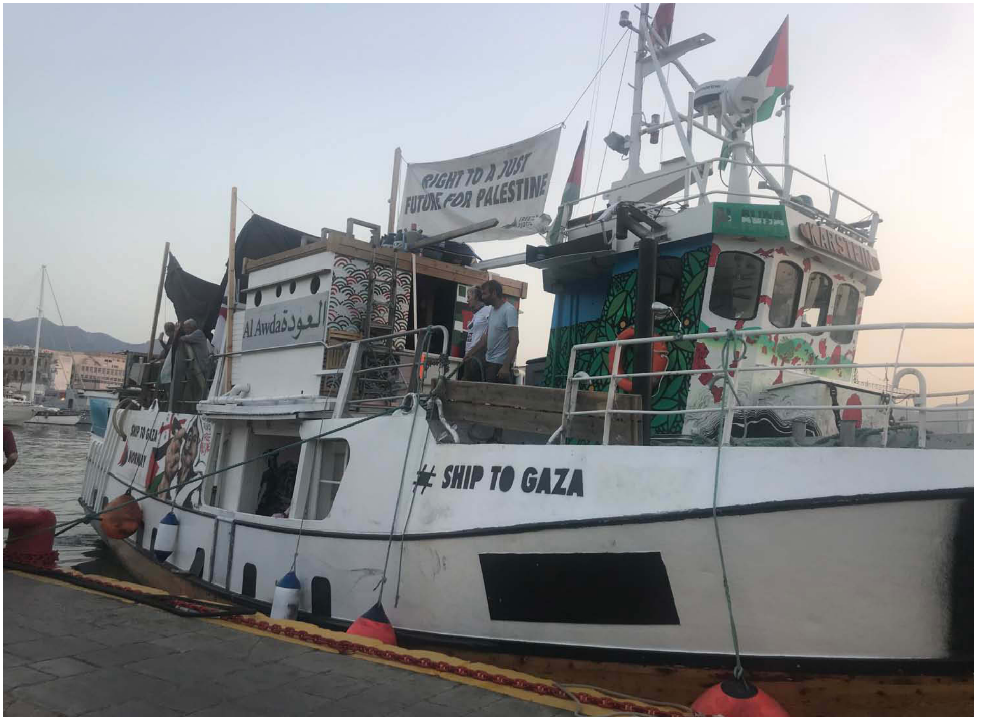
I år består frihetsflottan av fyra skepp. I söndags seglade de mot Gazaremsan.