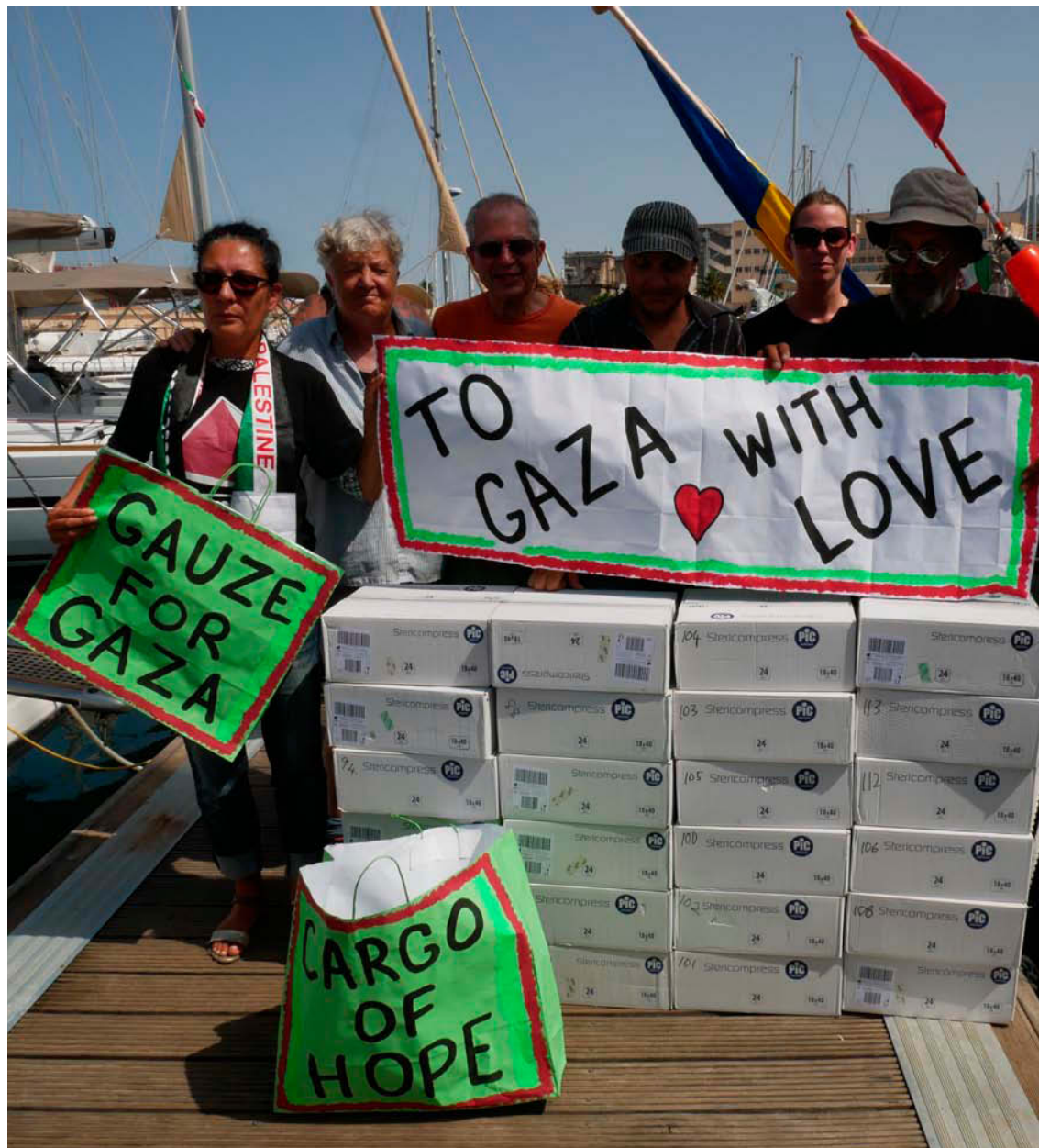
Medicin packas i lådor i Palermo.