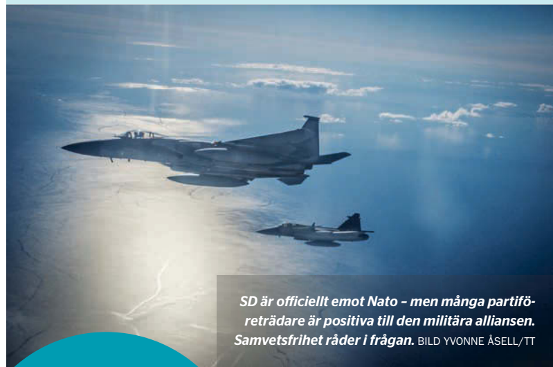
SD är officiellt emot Nato - men många partiföreträdare är positiva till den militära alliansen. Samvetsfrihet råder i frågan.

● Sverigedemokraternas officiella hållning är att Sverige ska vara militärt alliansfria, partiet motsätter sig både Nato och ett militariserat EU. Många av partiets företrädare är dock positiva till Nato, vilket lett till att partiledningen utlyst "samvetsfrihet" i frågan, det är accepterat att gå emot partilinjen. ● SD vill fördubbla Sveriges försvarsutgifter, till en nivå som är över den som Nato kräver. Sverigedemokraterna vill att försvarsanslaget senast inom tio år ska öka till minst 2,5 procent av BNP.