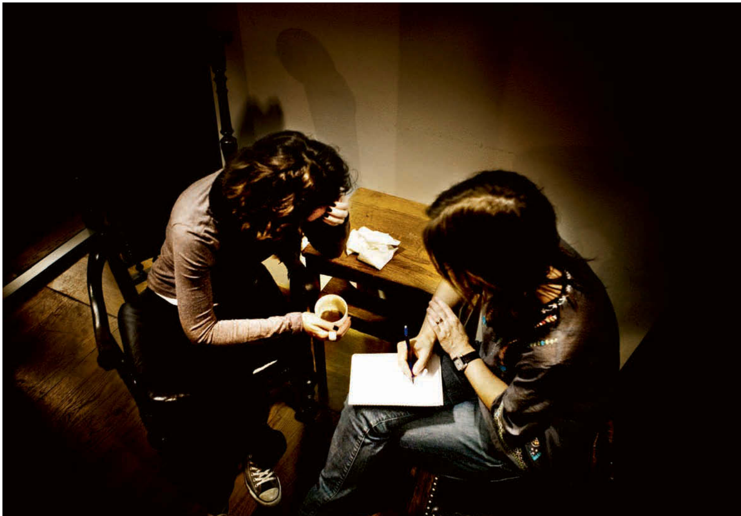
"Den som är i behov av hjälp ska snabbt kunna få ett första samtal och bedömning av vilken typ av stöd man behöver få", skriver debattören.