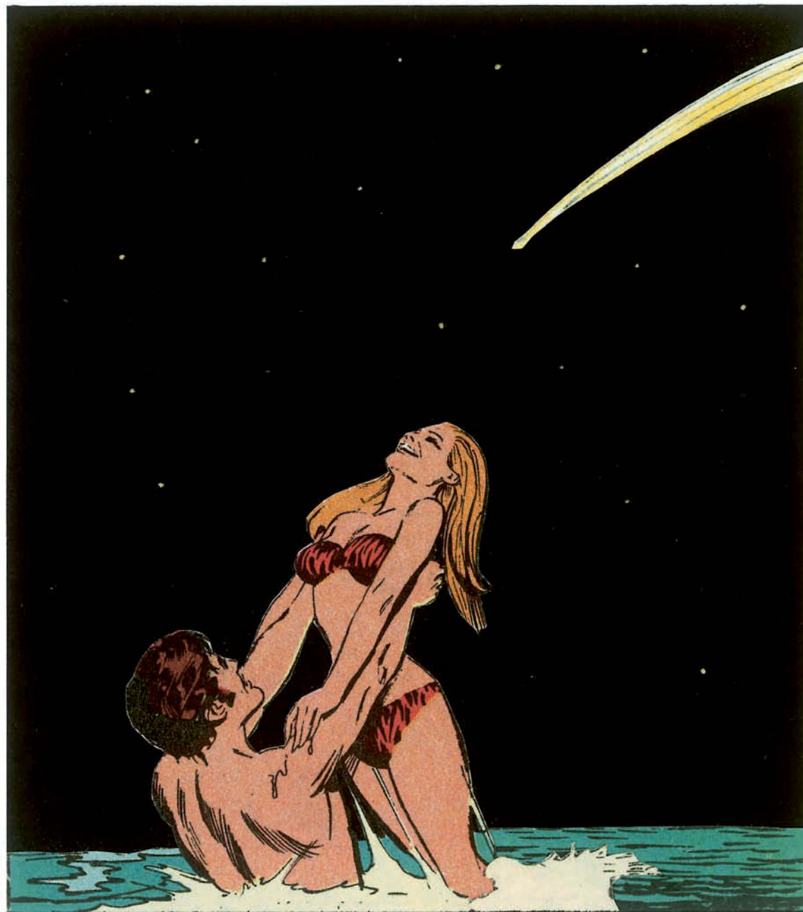
Ett onödigt stjärnfall.