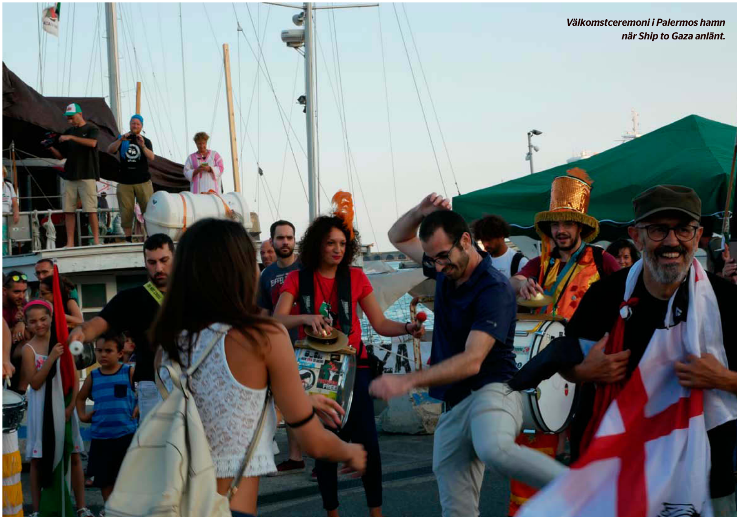
Välkomstceremoni i Palermos hamn när Ship to Gaza anlät.