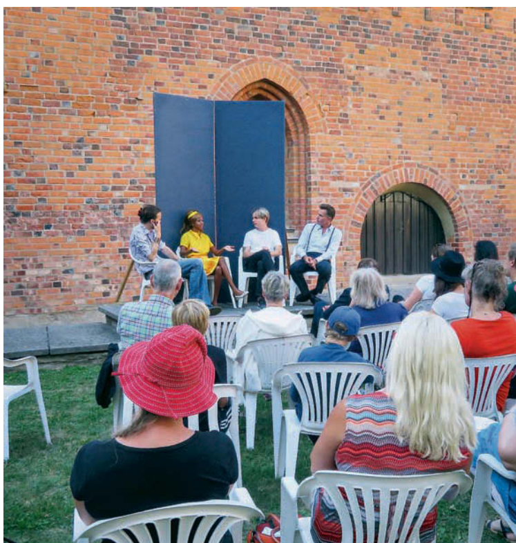
Under uppsnacket inför kvällens föreställning.