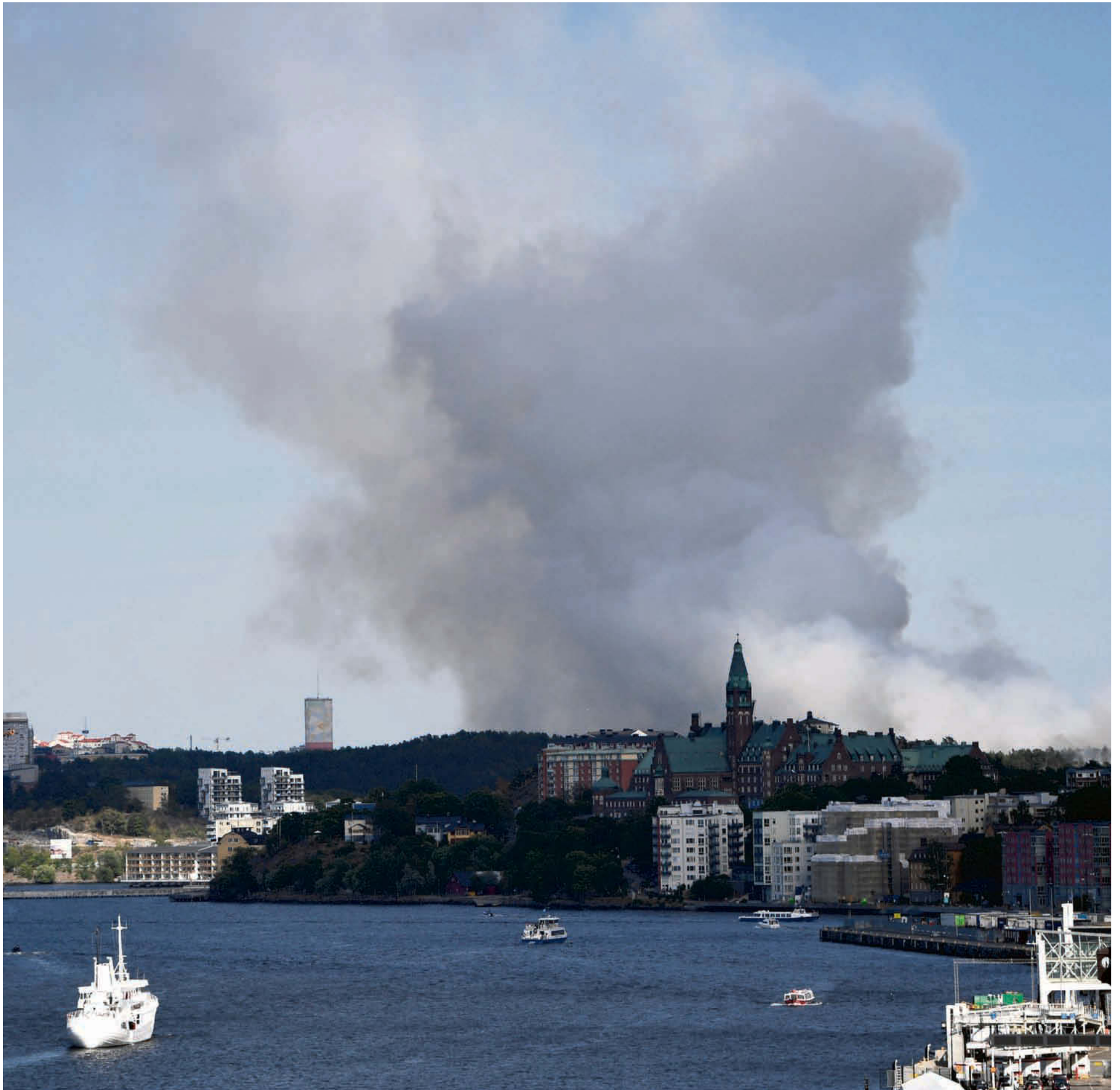
"Låt bränderna bli början på ett annat samhälle." Bilden är från branden i Nacka öster om Stockholm i juni.