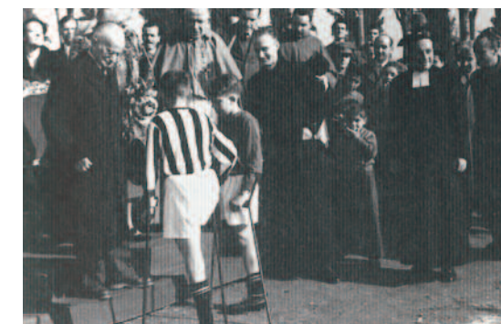
13 novembre 1950: inaugurazione del collegio “S. Maria ai Colli” da parte del presidente della Repubblica Luigi Einaudi