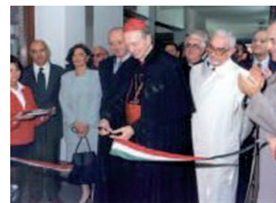
Il 24 ottobre 1998 il cardinale Martini inaugura il Centro ristrutturato dalla Fondazione Don Gnocchi. La struttura è diventata operativa dal mese di marzo '99