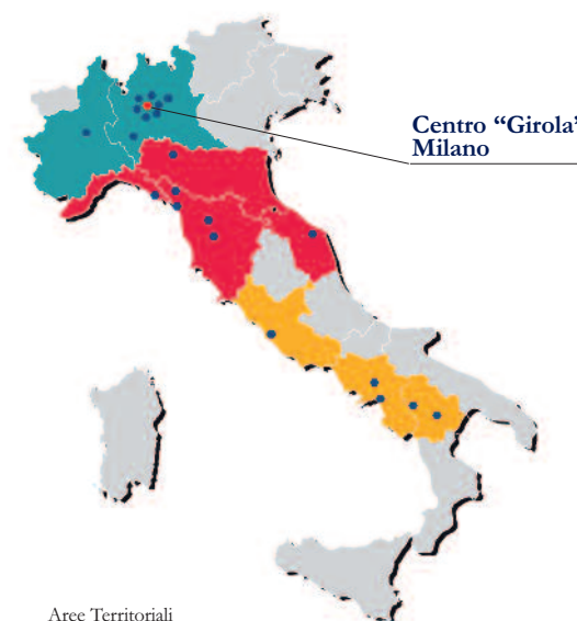
Aree Territoriali e Centri della Fondazione Don Gnocchi in Italia