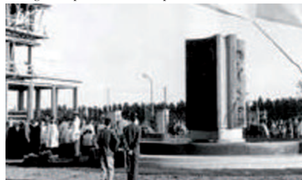
La posa della prima pietra del Centro, il 1° luglio 1959

Il Centro, ubicato nei pressi dell'ospedale Niguarda, fu realizzato dalla Fondazione "Carlo Girola" nel 1959 come orfanotrofo per accogliere, offrire istruzione e avviamento al lavoro a più di duecento ragazzi di famiglie disastrose dalla guerra, provenienti dalle province lombarde.