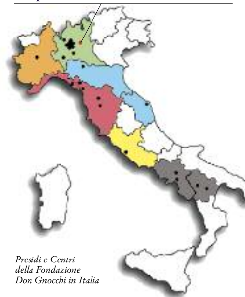
Presidi e Centri della Fondazione Don Gnocchi in Italia