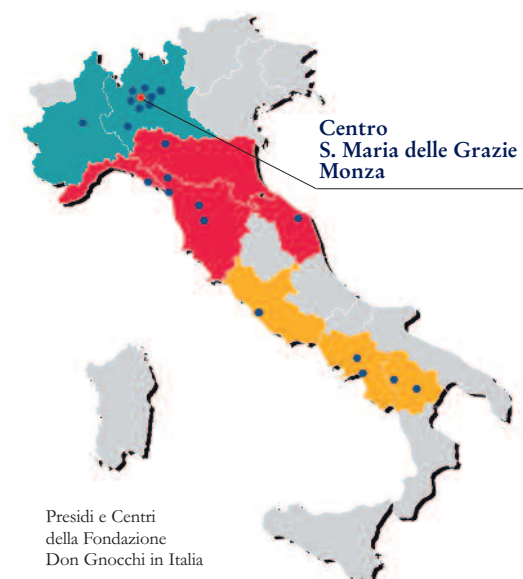
Presidi e Centri della Fondazione Don Gnocchi in Italia

Presidente della Fondazione Don Carlo Gnocchi