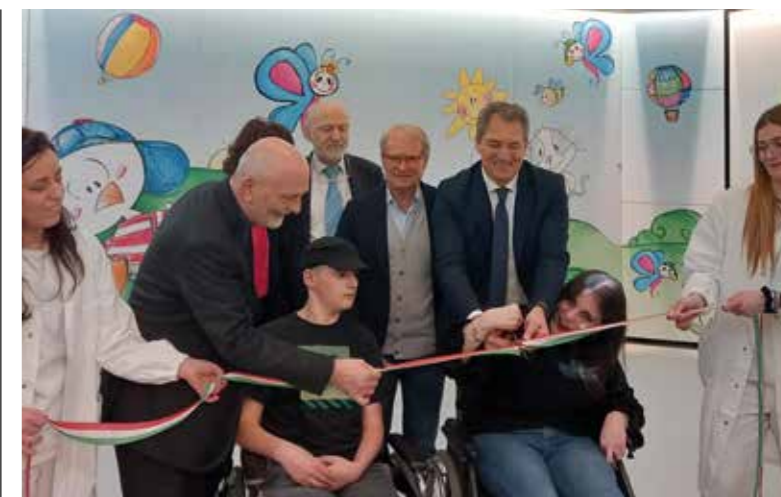
Il taglio del nastro del “CARE Lab” al Centro IRCCS “Don Gnocchi” di Firenze

«La riabilitazione erogata dal CARE Lab è personalizzata: all'inizio del percorso il riabilitatore verifica la situazione