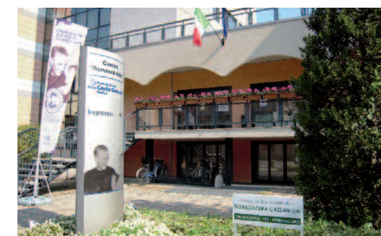
Due scorci del Centro “Ronzoni Villa” di Seregno

e di riabilitazione alle persone fragili del territorio, oltre che di formazione e di ricerca.