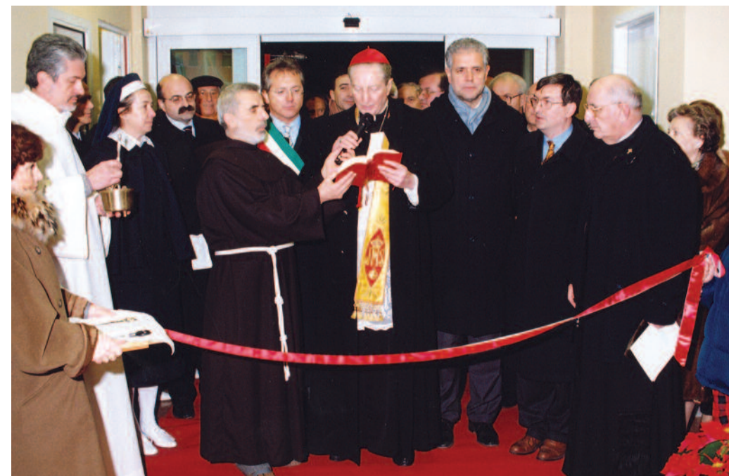
L'inaugurazione dell'Hospice "S. Maria delle Grazie" di Monza, avvenuta nel dicembre del 1999.