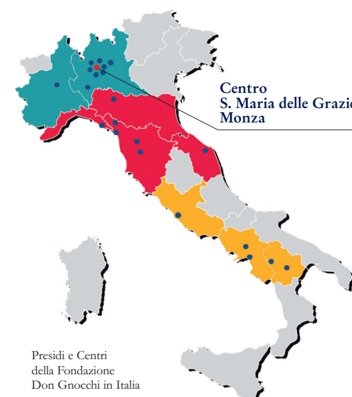
Presidi e Centri della Fondazione Don Gnocchi in Italia