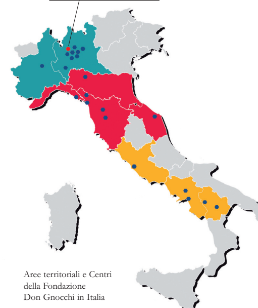
Aree territoriali e Centri della Fondazione Don Gnocchi in Italia

La Carta dei Servizi dell’Ambulatorio Polispecialistico è periodicamente revisionata per il costante adeguamento degli standard di qualità.