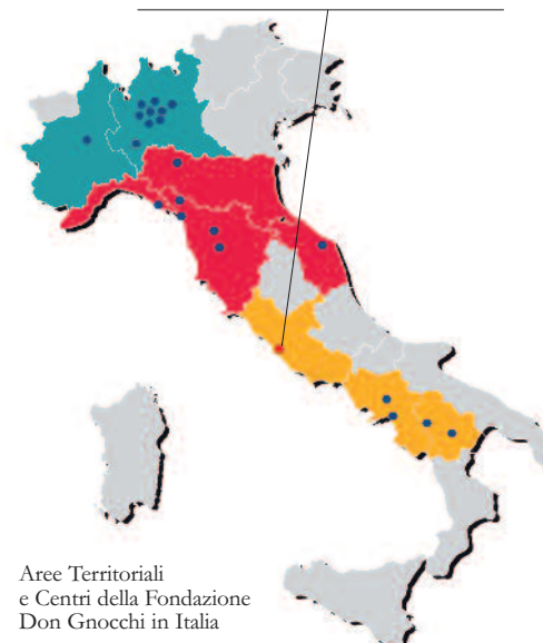
Aree Territoriali e Centri della Fondazione Don Gnocchi in Italia