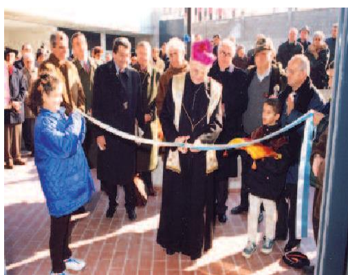
Un'immagine della cerimonia di inaugurazione del Centro di Lodi, avvenuta il 21 novembre 1998

Il Centro di Lodi, inaugurato nel 1998, sorge in un nuovo quartiere della città come parte integrante di un progetto che prevedeva la costruzione di un complesso parrocchiale costituito da una chiesa, un oratorio e una struttura riabilitativa.