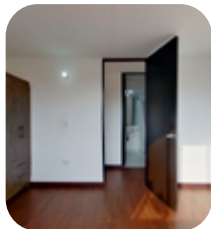
1 alcoba como mínimo