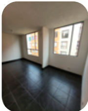
Salón o comedor o garaje cubierto o estudio