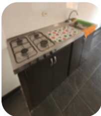
Lavaplatos sobre mesón