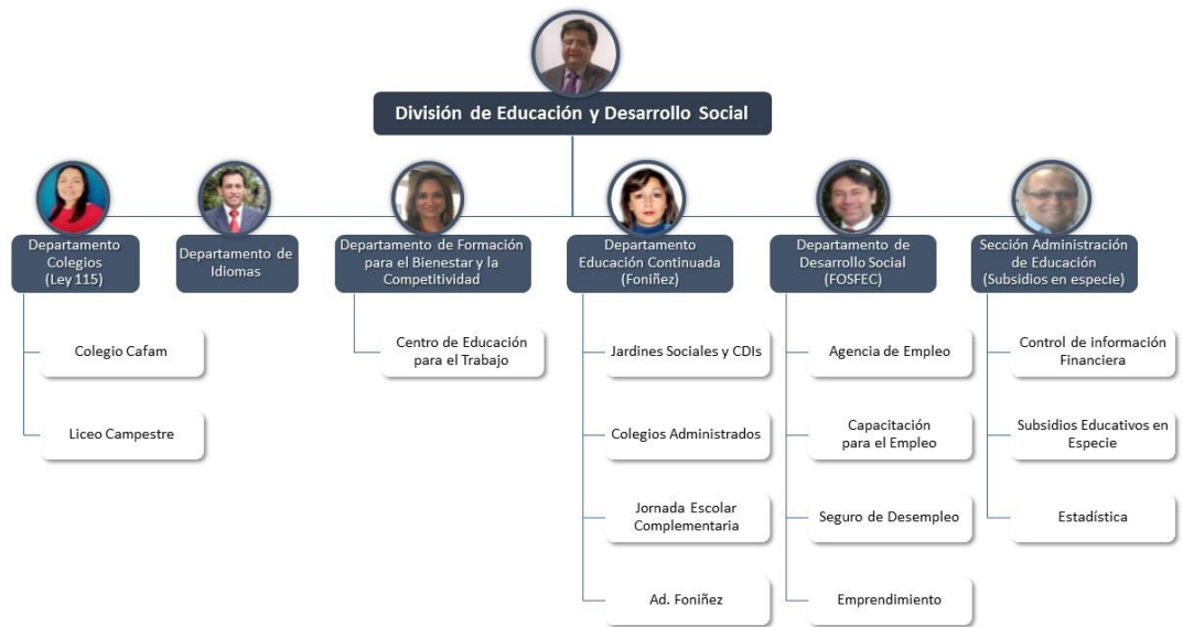
Figura 1. Organigrama División de Educación y Desarrollo Social